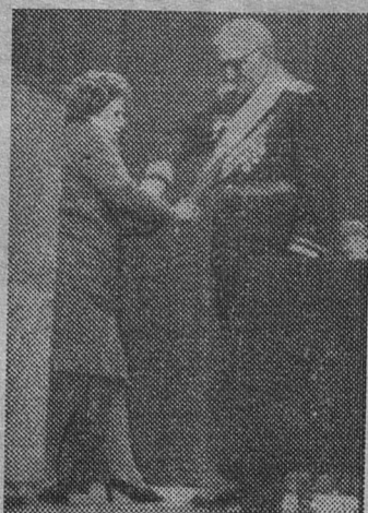
вич получает знак отличия почетного гражданина Гатчины.