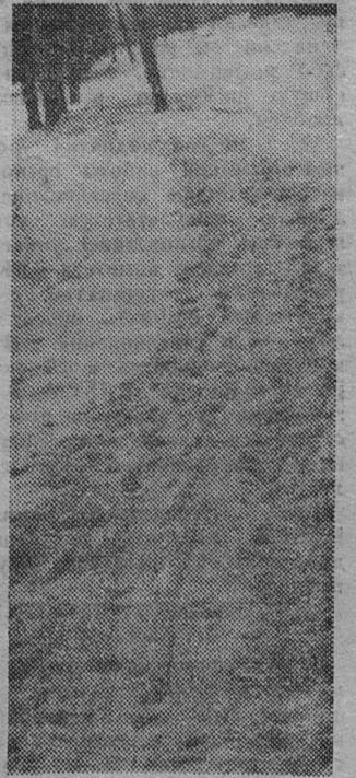
Здесь прошли лыжники...

В СЛЕДУЮЩЕМ НОМЕРЕ НАШЕЙ СТРАНИЦЫ «НА СПОРТИВНОЙ ОРБИТЕ» МЫ РАССКАЖЕМ О ЛЫЖНОМ ТУРИЗМЕ.