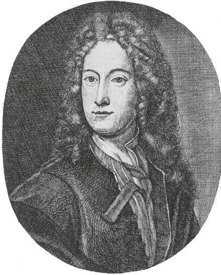
JOH PHILIP BREYNIUS

Рис. 4. Портрет Иоганна Филиппа Брейна 6