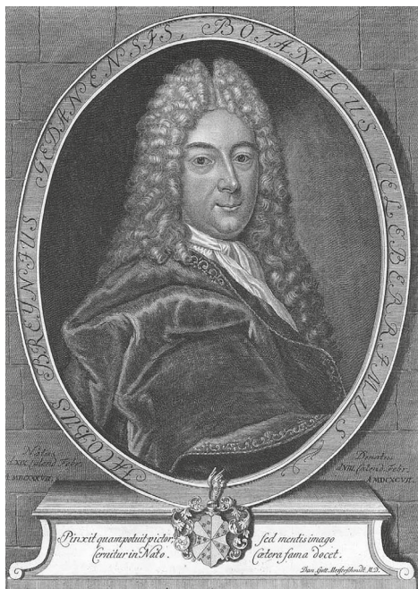
Рис. 1. Портрет Якоба Брейна (1637–1697) с гравюры Георга Пауля Буша (ум. 1756) 2