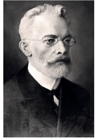
Фойницкий Иван Яковлевич (1847–1913)

И. Грабарь поступил в университет в 1889 г., а завершил обучение в 1893 г. Он получил хорошее гимназическое об-