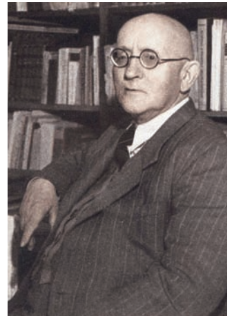
Грабарь Игорь Эммануилович (1871–1960)