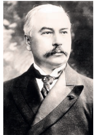
Мартенс Фёдор Фёдорович (1845–1909)