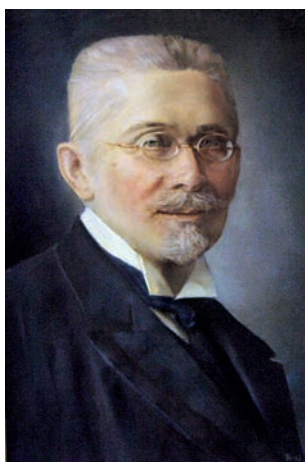
Сергеевич Василий Иванович (1832–1910)