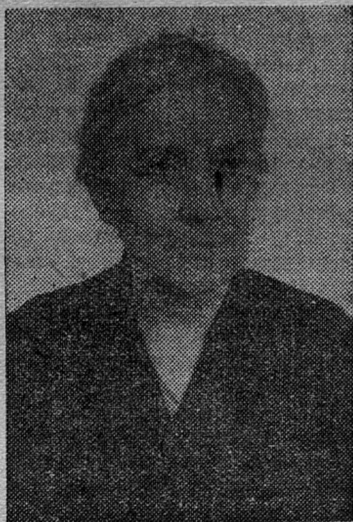
...Это было суровое время — блокада Ленинграда. По решению правительства