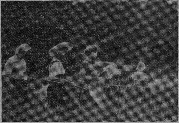
Каждый день группы студентов уходили в лес наблюдать природу.