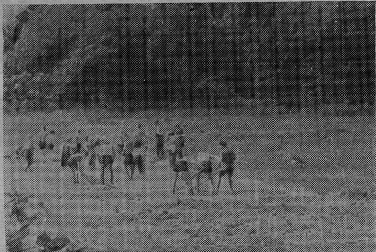
Так выглядела площадка в первые часы работы.