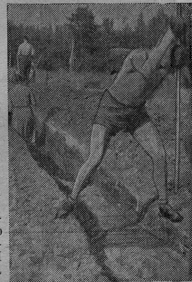
Твердый, ссохшийся грунт замедлял рытье траншей.