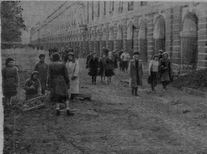
Асфальтирование университетского двора

Команда ЛГУ заняла II-е место в клубном и общем первенстве, показав высокую физическую культуру и дисциплинированность.