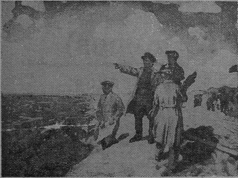
„С. М. Киров указывает место для постройки стадиона на Кировских островах“.