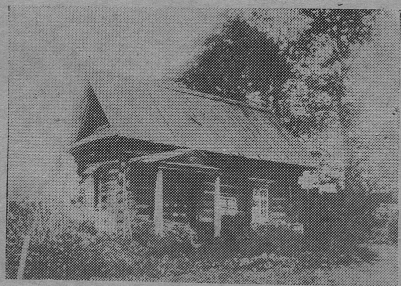
Баня в г. Уржуме, в которой С.М. Киров печатал листовки в 1904 г.