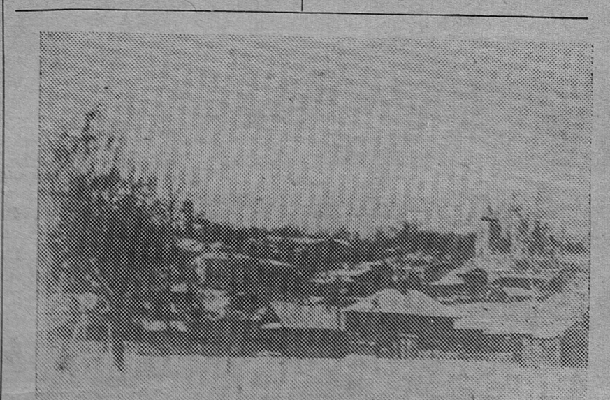
Общий вид г. Уржума, где родился и провел детство С. М. Киров.