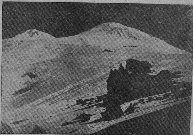
Вид на Эльбрус с высоты 4200 м.