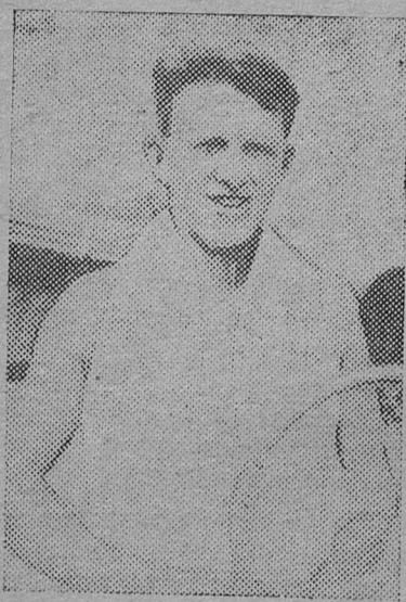
Один из лучших теннисистов ЛГУ теннисист 1 класса