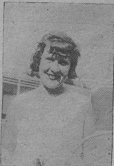
Тренер теннисистов ЛГУ теннисистка 1 класса