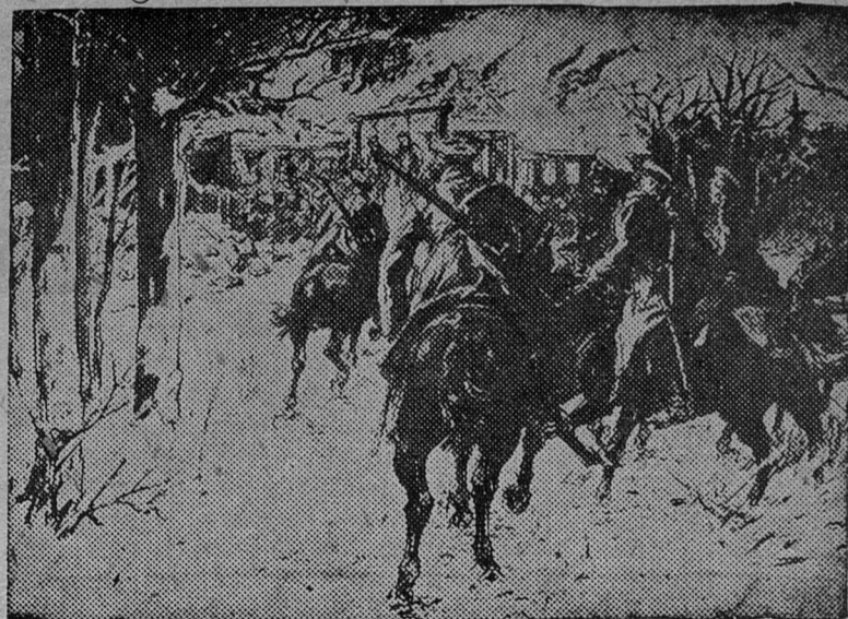
1905 г. Поджо барской усадьбы

том. Значение отметки, пятерки, конечно, огромно. Отметка стимулирует, подталкивает, одобряет, награждает. Отметка, как и всякая статистика, конечно, характеризует работу студента. Но отметка имеет не только количественную, но и качественную сторону. Если студент получил свою четверку или даже тройку в результате самостоятельного творческого труда , если он в процессе, скажем, перевода иностранного текста вдоволь потрудился, пораскинул мозгами, мобилизовал свои грамматические познания,—его работа прекрасна.