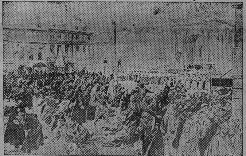
1905 год. Кровавое воскресенье

них мы ввели просеминарии более углубленного типа, с ограниченной тематикой, построенные на изучении, главным образом, источников (в переводах). Эта реформа, проведенная на всем I курсе, имела целью повышение уровня преподавания и, насколько можно судить по опыту Древней истории, себя оправдала.