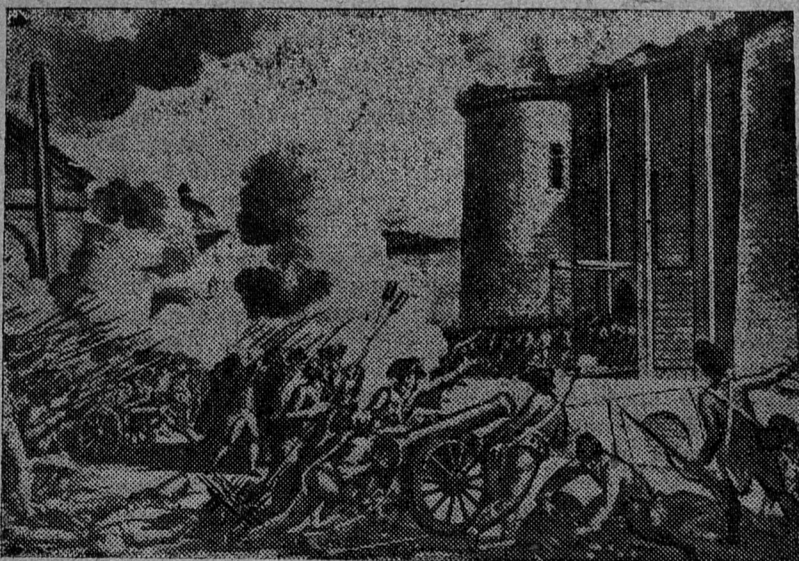
14 июля 1789 г. Взятие Бастилии.

«В стране победившего пролетариата история делается мощным оружием гражданского воспитания, потому что это подлинная и правдивая история, потому что пролетариат — единственный из господствующих классов, которому нечего скрывать в своем прошлом, который пришел к власти не путем преступлений, а путем героической борьбы за счастье всех трудящихся».