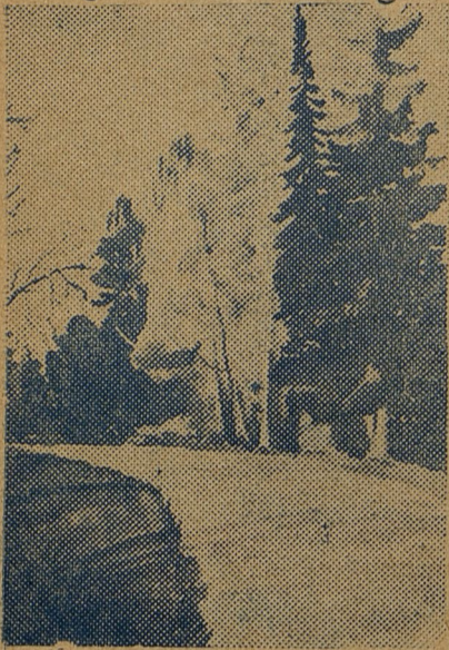
Радлова — „Этюд“