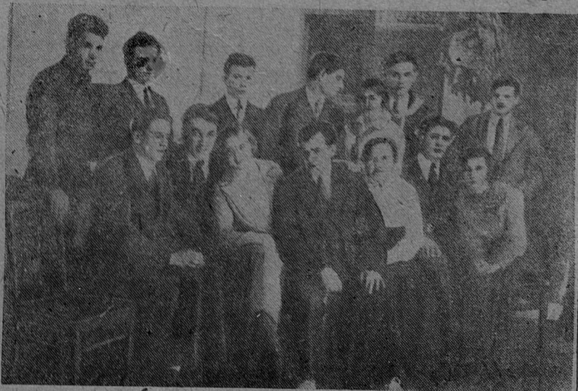
Драматический кружок Ленинградского горного института