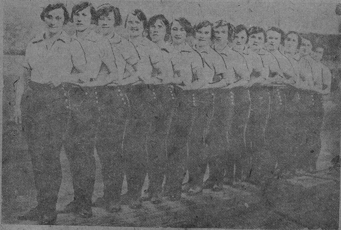
Команда гимнасток нашего Университета