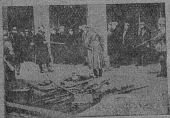
Австрия. Февраль 1934 г. После подавления героического восстания австрийских рабочих. Войска и полиция разоружают взятых в плен рабочих-оружейников. На переднем плане — отобранные у рабочих винтовки и патроны.