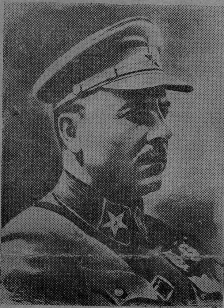
Клементий Ефремович ВОРОШИЛОВ Народный комиссар обороны СССР, маршал Советского Союза

„Наши границы священны и ненарушимы. Они полны рабоче-крестьянской кровью, и их никогда, ни при каких обстоятельствах перейти мы не позволим“. (К. ВОРОШИЛОВ).