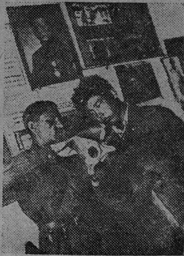
За изучением противогаза