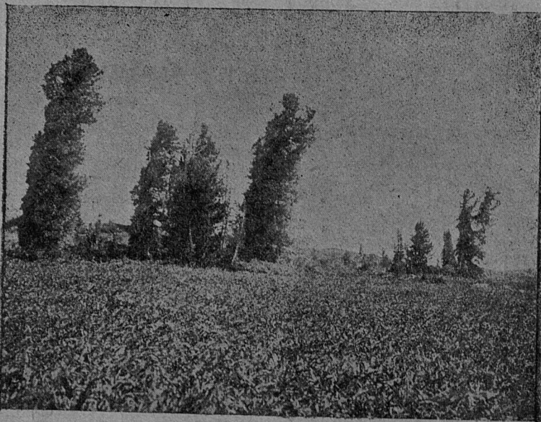
Алтайский госзаповедник. Верхняя граница кедра на высоте 1900 м.

Летом 1935 г. кафедрой геоботаники ЛГУ была организована экспедиция в Алтайский госзаповедник, давшая богатейший научный материал