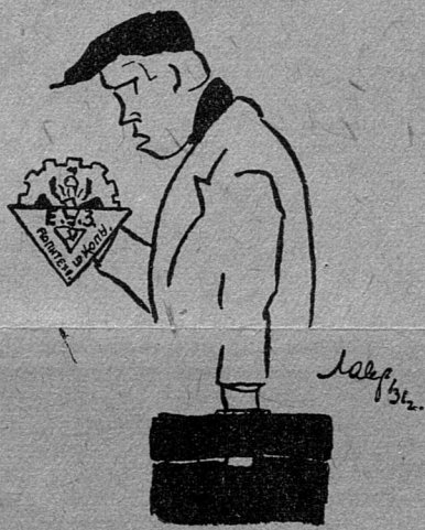
Купил значек, чего же боле