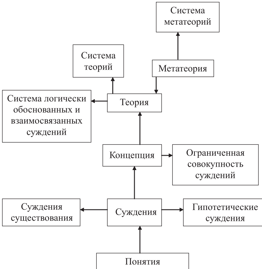
Рис. 2. Продукты теоретизирования (типы теоретического знания)

ческих теорий, релевантных нашему объекту исследования. Ищем не авторов, а теории, потому что у одной теории может быть несколько авторов.