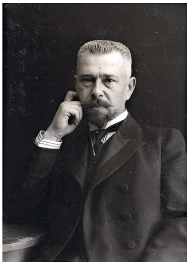
С. Т. Варун-Секрет