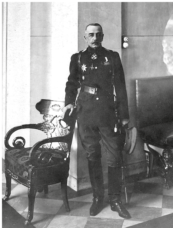
Министр внутренних дел А.Д. Протопопов в жандармском мундире. Петроград, 1916

не теряться в неожиданной обстановке его деятельности, но, однако, и не выдвигало его в ряды вождей. Для этого он не имел ни личных данных, ни призвания. Политика не захватывала его глубоко и даже отталкивала своей неприглядной закулисной стороной интриг, лжи, лицемерия, тем более что все это в значительной степени скрывало за собой личные цели, честолюбивые замыслы и нечистоплотные приемы.