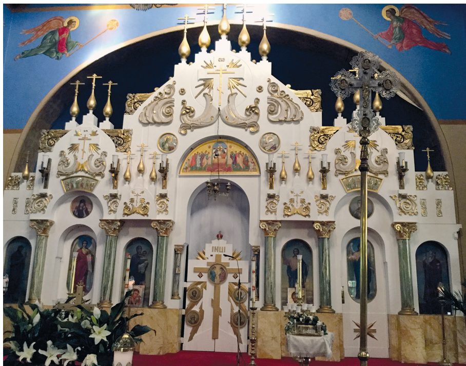
Рис. 2. Иконостас, построенный по проекту Верховского для Троицкой церкви в Йонкерсе. Нью-Йорк.

Из него же (только цвета порфира) выполнены колонны, фланкирующие Царские врата и иконы первого ряда, а также базы и капители колонн. Иконостас выполнен из белоснежного гипса и богато украшен позолоченным лепным декором (кресты, растительные мотивы). Один из главных художественных акцентов всего произведения — позолоченные фигуры двух ангелов с расправленными вверх крыльями. Перья крыльев, локоны волос на пышных прическах «завиваются» в волути, отсылая к эпохе итальянского барокко.