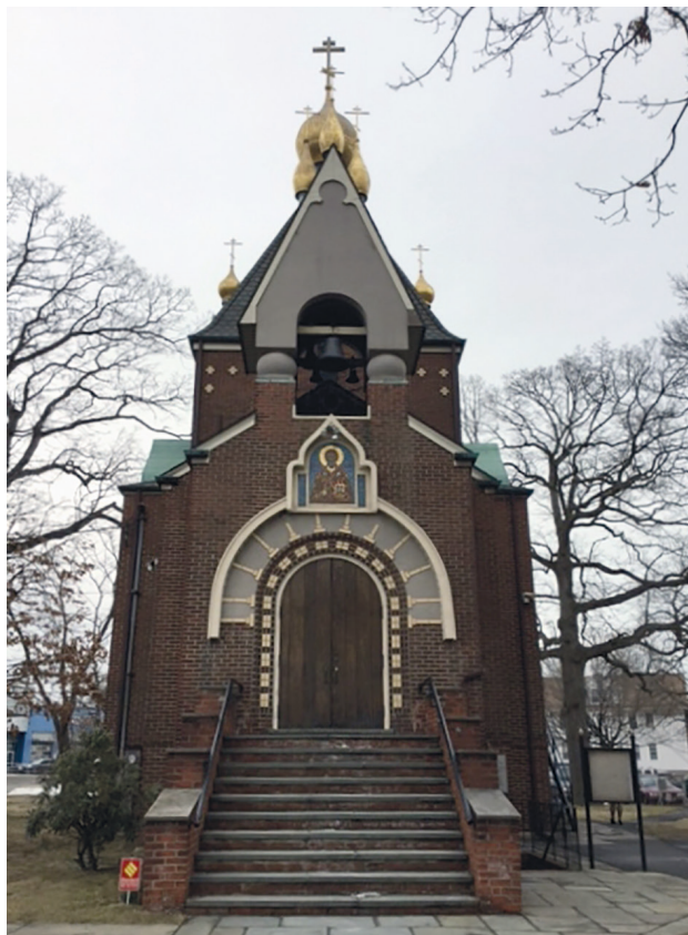
Рис. 5. Западный фасад Свято-Николаевского храма в Стратфорде (Коннектикут).

в 1944 г. Верховским, был отвергнут настоятелем монастыря отцом Пантелеймоном [XIV].