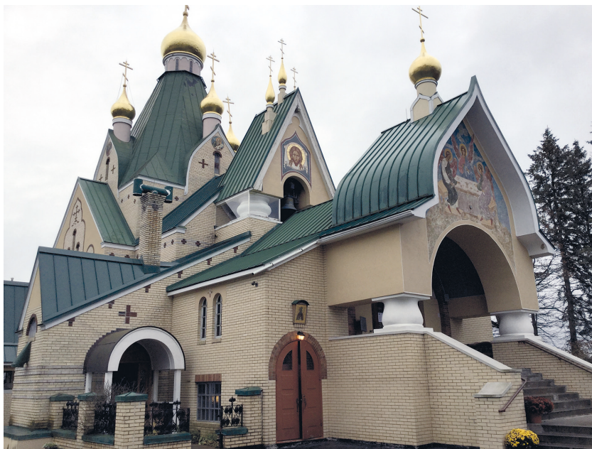
Рис. 9. Северный и западный фасады Троицкого собора монастыря в Джорданвилле.

всего-навсего комнату у своего товарища инженера Ордынского в округе Суффолк, штат Нью-Йорк.