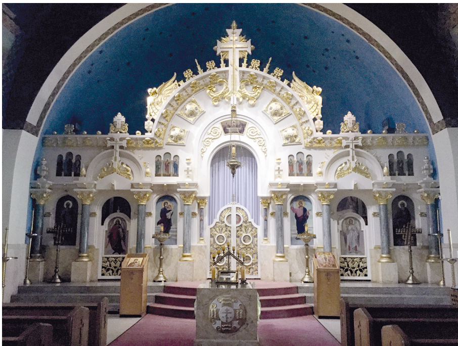
Рис. 1. Иконостас, построенный по проекту Верховского для церкви Св. Иоанна в Монессене, Пенсильвания.

Однако реализованные проекты не называются, упоминается лишь факт, что Верховской «предпринял два проекта для греческой епархии и один для создания буддийского храма» [21, р. 39]. Леонова также указывает, что после себя Верховской оставил «немного церквей, несколько иконостасов и нереализованный проект Всеамериканского собора» [21, р. 38–9]. В действительности, как уже было указано, Верховской — автор 12 реализованных проектов храмов, из которых пять были разработаны для греческих церквей, но реализован только один (иконостас и престол для Свято-Троицкой церкви в Бриджпорте, Коннектикут). Утверждение о «нескольких иконостасах» тоже неверно: Верховской разработал 16 проектов иконостасов, из которых было реализовано 14.