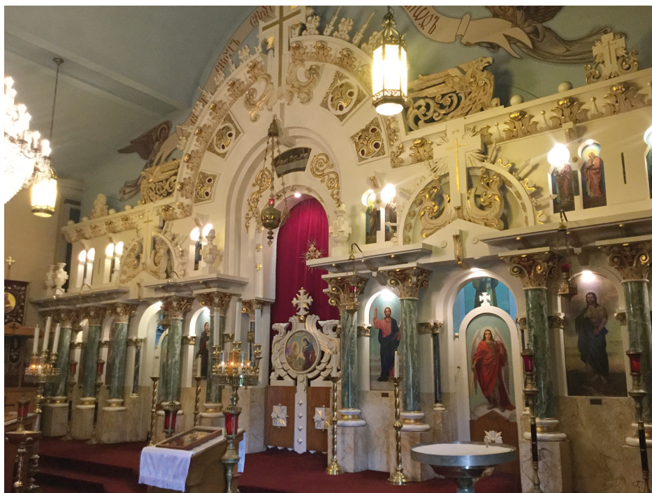
Рис. 3. Иконостас, построенный по проекту Верховского для церкви Святого Георгия в Мидланде, Пенсильвания.

Ярко выраженная «скульптурность», плавные абрисы, сложный силуэт и нестандартный художественный замысел — эти черты отличают иконостасы Верховского от иконостасов других архитекторов.