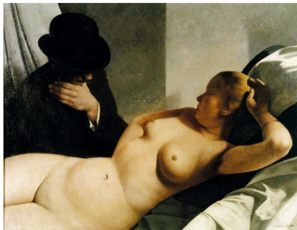
Рис. 11. Феличе Казорати. Платоническая беседа (Conversazione platonica). 1925. Доска, масло. 78 × 100. Частная коллекция

об искусстве режима, в то время как в появившейся тогда же редакторской статье газеты «Popolo d'Italia» он разразился риторикой о необходимости нового искусства для «фашистской цивилизации» [27, р. 235].