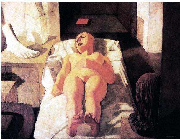
Рис. 6. Феличе Козарати. Спящая девушка, или Заснувшая девушка (Fanciulla dormiente o fanciulla addormentata). 1921. Холст, темпера, лак. 90 × 112. Утрачена