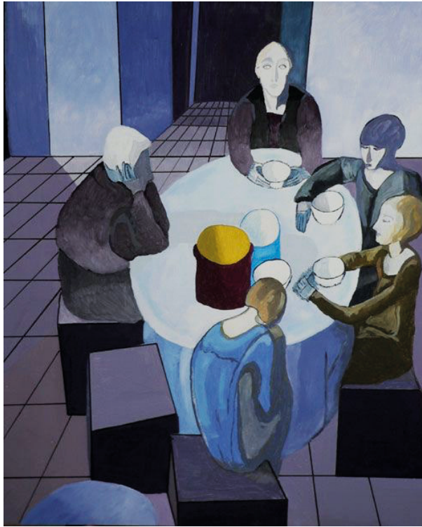
Рис. 3. Феличе Казорати. Утро, или Завтрак (Mattino o Colazione). 1919–1920. Холст, темпера. 178 × 146. Частная коллекция

работах художника. Напряженность фигуры, сидящей в полумраке и подсвеченной холодным боковым светом, усиливает лаконичный, жестко очерченный силуэт. Отсутствующее выражение лица женщины, словно находящейся во власти галлюцинаций, подчеркивается сходством со стоящей рядом терракотовой головой с пустыми глазницами (работы самого Казорати 1914 г.).