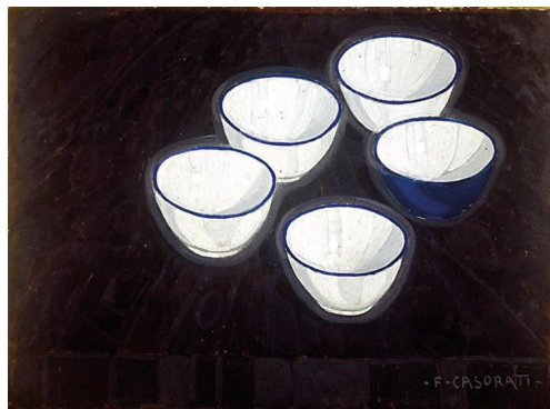
Рис. 4. Феличе Казорати. Миски (Le scodelle). 1919. Картон, темпера. 178 × 146. Частная коллекция