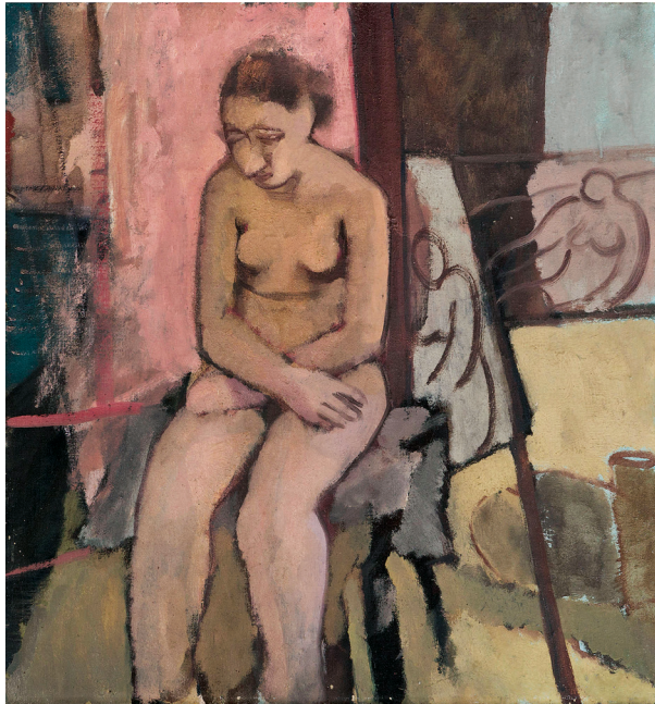
Рис. 14. Феличе Казорати. Обнаженная в мастерской (Nudo nello studio). 1936. Холст, масло. 50,3×47. Частная коллекция

к теме женской наготы, где контуры фигур все менее очерчены, хроматические переходы выдержаны в духе экспрессионизма, как в «Обнаженной в мастерской» (рис. 14) и в «Обнаженной» 21 . Тела словно надвигаются на зрителя, формы вытянутых лиц усилены грубыми тенями с утрированными или, наоборот, совсем отсутствующими носами и ртами, они монументальны. Художник все менее очарован своими моделями, все более отстранен и ироничен, кажется, что сами тяготы и противоречия жизни в Италии в тридцатые годы нашли отражение в искаженных лицах и телах полотен Казорати. Критики назовут его «певцом несимпатичных женщин и девушек», обвинят в равнодушии, холодной бесчувственности, рациональности, обобщении, оторванном от реальности [49]. Его далекие от классицизма ню определялись как надуманные, искусственные, особенно в тех работах, в которых он отказывался от спасительного фона мастерской, допускавшего некоторую «постановочность». С полотен этого периода на нас смотрят усталые модели с гипертрофированными неуклюжими руками и ногами, взглядами словно обращенными внутрь себя... они застыли в абсолютном одиночестве, напряженной меланхолии, их совершенная изоляция от окружающего мира почти трансцендентальна, они словно потеряли всякое желание быть внешне привлекательными, быть увиденными. Этой бесконечной тишиной, искаженными формами человеческого тела художник как будто дает оценку тому, что происходит в стране и в искусстве. Женщина, женское тело, способы его изображения, занимающие Казорати