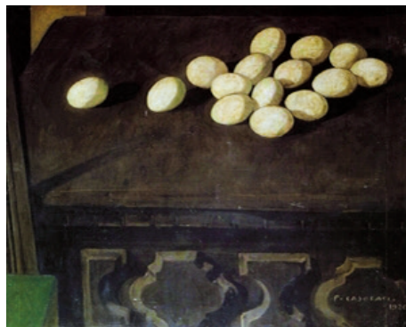
Рис. 5. Феличе Казорати. Яйца на комодe (Uova sul cassettone). 1920. Доска, темпера. 48 × 63. Частная коллекция

о котором в 1943 г. он скажет: «Нельзя исключить влияние жизненных обстоятельств на художников, обстоятельства могут повернуть их творчество в ту или иную сторону. Если бы не свалилось на меня в ту пору столько бед, не родились бы тогда эти угловатые фигуры, галлюцинирующие, испуганные, погруженные в призрачный свет, в котором тщетно было бы искать дружелюбную тональность, мягкость смыслов» [7, p. 49].