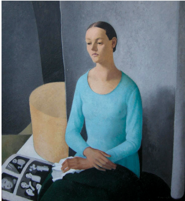
Рис. 12. Феличе Казорати. Портрет Дафне (Ritratto di Dafne). 1928. Доска, масло. 110×100. Частная коллекция

изучающего в мастерской «заораживающий тон плоти», другой словно позаимствован у античной статуи [45, p. 525]. Перед нами своего рода эстетический гибрид, пленительное сочетание театрального и чувственного. В «Платонической беседе» Казорати, размышляя о классицизме, отступает от него, ставит под сомнения его принципы. Несмотря на это, его работы будут и впредь занимать почетные места на всех основных выставках Новеченто в Италии и за рубежом [21, p. 87].