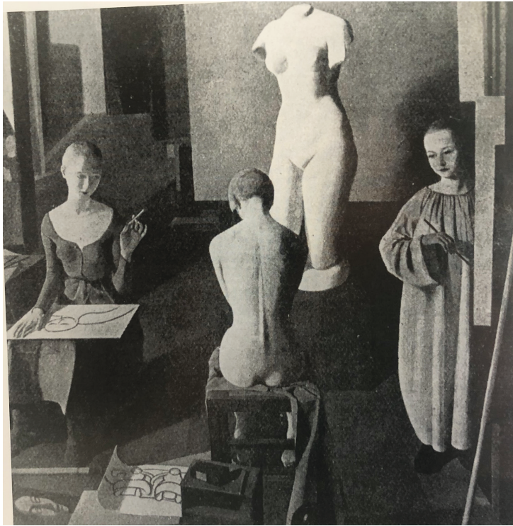
Рис. 8. Феличе Казорати. Мастерская (Lo studio). 1923. Доска, масло. 200 × 198. Утрачена

сицизма» Казорати, в данном случае скорее «неокватрочентизма», вдохновленная Пьеро делла Франческа, его «Алтарем Монтефельтро» и полиптихом «Мадонна делла Мизерикордия» [33, р. 192–3]. Изящная фигура, одетая в белое, кажется, благодаря фронтальной торжественности позы, загадочным божеством, запертым в безупречно артикулированном геометрическом пространстве. Прозрачный свет четко вырисовывает силуэт, отдельные предметы композиции, убегающее в глубину пространство, построенное по законам современной перспективы, имеющим мало общего с традицией кватроченто. Все элементы холста кажутся невесомыми, доминирует чистота и ясность пластических форм и объемов, по которым скользит свет. Кажется, что художник стремится воплотить здесь саму квинтэссенцию живописи, идеальный женский облик, идеальный пейзаж, идеальный натюрморт.