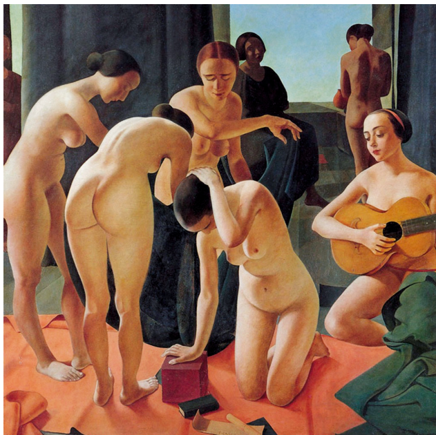
Рис. 9. Феличе Казорати. Концерт (Concerto). 1924. Фанера, темпера. 152×151. Коллекция итальянского радио и телевидения РАИ, Турин

предпринять попытки повторить картину, но, по утверждению его собственному и тех, кто видел оригинал, художнику уже не удастся достичь первоначальной интенсивности и пронзительности [34].