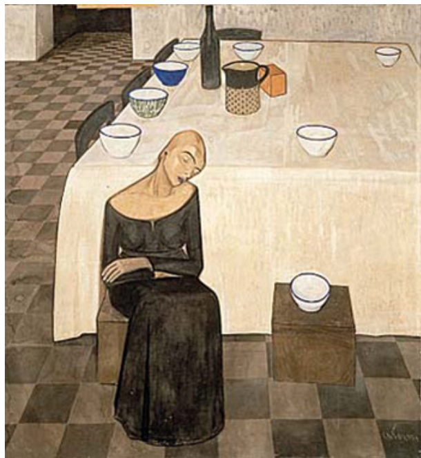
Рис. 2. Феличе Казорати. Женщина, или Ожидание (Una donna o Lattesa). 1918–1919. холст, Темпера. 139 × 130. Частная коллекция