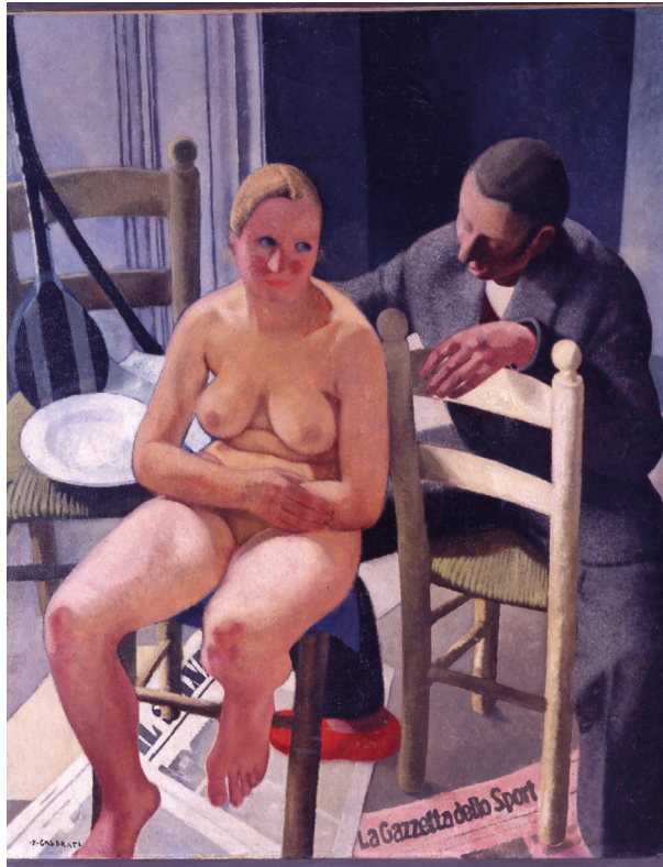
Рис. 13. Феличе Казорати. Сюзанна (Susanna). 1929. Холст, масло. 123×98. Коммунальная галерея современного искусства, Рим

загадки. Персонажи сидят на стульях возле окна, из которого резко бьет свет, их разговор представляется самым заурядным. Женщина полностью обнажена, но нагота ее лишена привлекательности. Бросается в глаза значительная деформация женской фигуры, формы пластически выявлены, но подчеркнуты в манере, совершенно противоположной классической. Кажется, что за четыре года, прошедшие между двумя работами, художник радикально изменил свое отношение к традиции, потерял неколебимую веру в классические принципы, обретя взамен веру в собственную технику и способность к эксперименту, к поиску более современных путей в живописном выражении чувственности [46, р. 40].