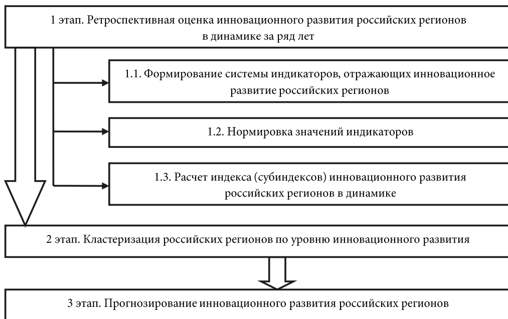
Рис. 1. Методика оценки инновационного развития регионов России

Как видно из рис. 1, на первом этапе предложенной авторами статьи методики производится ретроспективная оценка инновационного развития регионов России в динамике за ряд лет. Для этого рассчитывается индекс (субиндексы) инновационного развития субъектов РФ по данным региональной статистики.