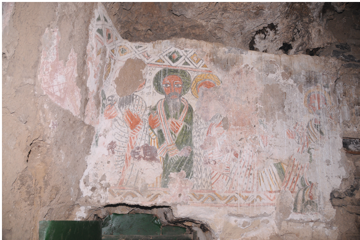
Рис. 4. Росписи в юго-западной части скального храма Йоханнис Мэтмык Кохоло. Фото С. Клюева, 2019

баны. Только крайний справа апостол представлен в нимбе. Руки святых написаны на уровне груди ладонями к телу: в правой руке они держат кресты. Лики и руки выполнены красным цветом. Изображение обрамлено сверху орнаментом в виде ромбов, снизу — зигзагообразным.