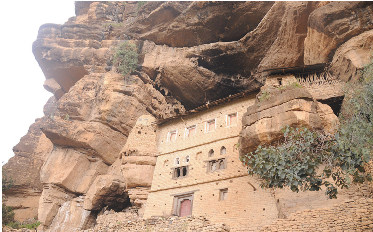
Рис. 7. Абуна́ Арэга́ви Зэйэ. Внешний вид комплекса. Фото С. Ключева, 2019

1985 г. [15, р. 149–150]. Р.Плант дает лишь краткое описание внешнего вида комплекса. Статья содержит несколько важных фотографий, однако план расположения построек отсутствует. В книге 1985 г. исследовательница дополняет текст описанием пещеры, представленным в статье Д.Косэра в издании Уэссекского пещерного клуба за 1962 г. [21]. Особое внимание пещере как важному культурно-геологическому объекту уделено в коллективных работах 2019 г. под руководством бельгийского геолога Яна Ниссена [22; 23].