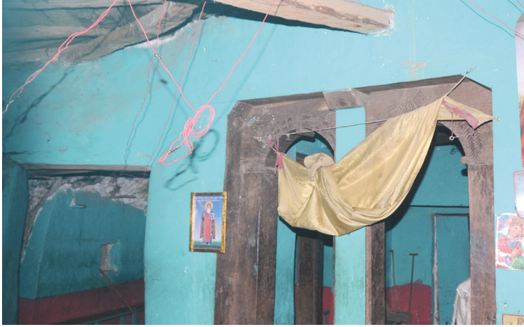
Рис. 6. Интерьер храма Микаэль Цэхило (вид на северо-запад). Фото С. Ключева, 2019

вероятно, один из них нам удалось обнаружить в притворе — открытой части храма. Он представляет собой вырезанный из цельного ствола дерева прямоугольный в сечении столб с расширяющейся сверху капителью, что придает ей трапециевидную форму. Такие формы традиционны для эфиопского зодчества. Высота столба 190 см, ширина стороны около 28 см.