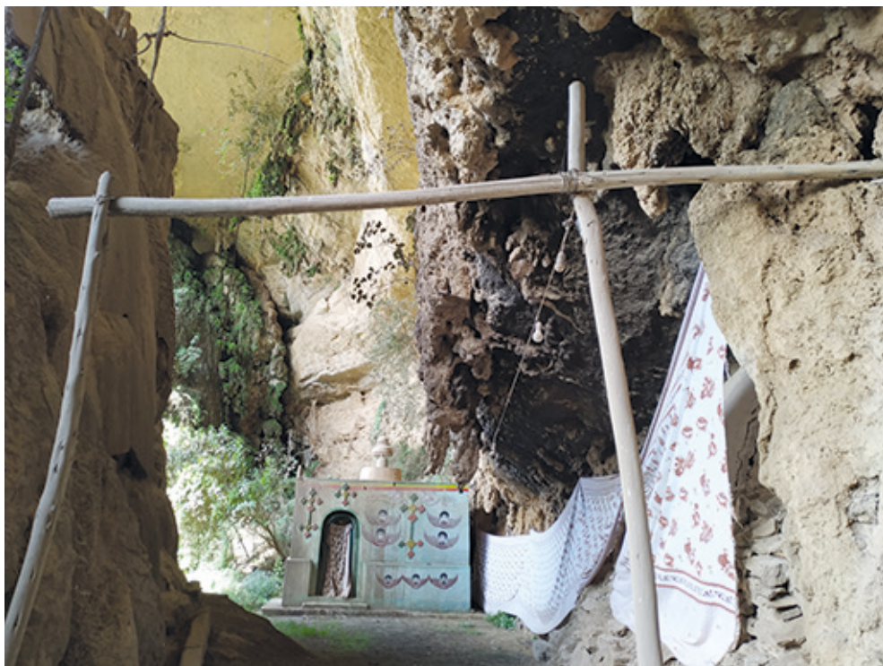
Рис. 11. Новое здание — măkdəs на месте храма Цадыкан Тэнсьхе. Слева за завесой пещерные части разрушенного старого храма. Фото С. Ключева, 2019

В настоящее время в роли церковного здания выступает пространство, образованное особенностями ландшафта: с запада оно ограничено крупными камнями, осыпавшимися с верхних частей скалы, с востока — скальным утесом. Здесь в скале вырублены, а скорее всего, расширены естественные пещерные помещения, ранее используемые как măkdəs, теперь, вероятно, в качестве гробниц или церковных хранилищ, они скрыты от посторонних глаз тканевыми завесами и недоступны для осмотра. Также через ткань здесь просматривается фрагмент кладки с использованием деревянных элементов, закрывающей отверстия внутри скалы. Вдоль указанных скальных отверстий нависает на высоте около 2,5–3 м скальный карниз, вероятно, ранее служивший частью свода полускального храма. Об этом косвенно свидетельствуют следы сажи на его поверхности.