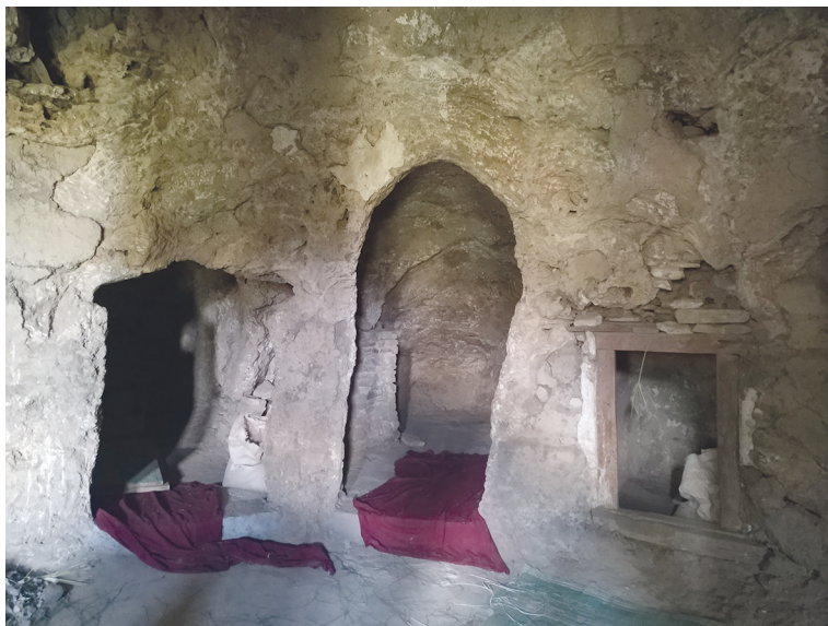
Рис. 3. Йоханнус Мэтмык Кохоло. Общий вид мэкдэса. Фото С. Ключева, 2019

Мэнбэрэ-табот (mänbärä tabot) 13 прямоугольной формы, сложен из камней, вплотную примыкает к северной стене помещения, расположен сразу к востоку за проходом в северную часть мэкдэса. Таким образом, его местоположение компенсирует неточную ориентацию самого помещения на восток. В восточной стене северного компартамента обнаруживается фрагмент каменной кладки, закрывающий, вероятно, некий ход либо значимое захоронение.