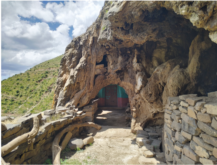
Рис. 5. Внешний вид храма Микаэль Цэхило с восточной стороны (вход). Фото С. Ключева, 2019

численные расщелины и пустоты в скале заложены каменной кладкой и содержат захоронения (рис. 5).