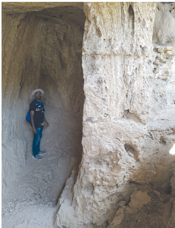
Рис. 10. Один из сохранившихся фрагментов скальной церкви Киданэ Мыхрэт в Тэнсыхе. Фото С. Клюева, 2019

На территории монастыря были обнаружены деревянные детали, элементы церковных зданий (в частности, фрагменты арочных рам окон и дверей), вероятно, относящиеся к старой наземной церкви Сылласе.