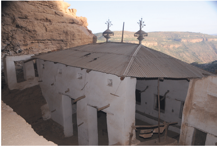
Рис. 9. На территории комплекса Абунэ Арэгави Зэйэ. Вид на юго-восток.

Арэгави и змея, а также ряд слабо различимых фрагментов [19, MG-2005.173:007; MG-2005.173:008; MG-2005.173:009; MG-2005.173:010]. Стилистически их можно датировать первой половиной XX в.