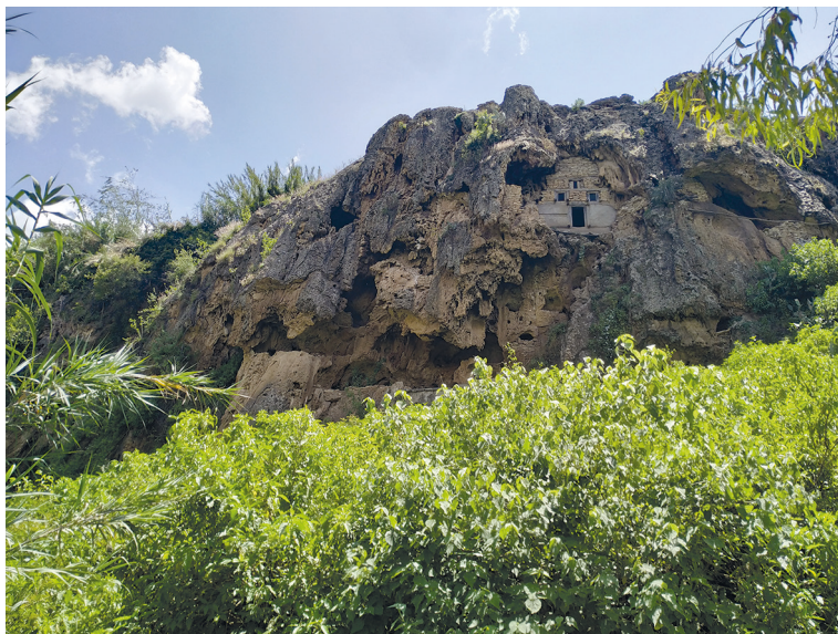
Рис. 1. Скальный храм Йоханнис Мэтмык Кохоло. Внешний вид с северо-западной стороны. Фото С. Ключева, 2019

раз креста. Две деревянные балки — продольные связи стены — логично объединяют аксумские рамы оконных и дверного проемов.