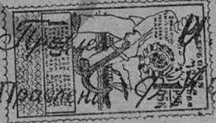
Приложение к книге: Проф. В. М. Гордон. Положение о векселях в частной кодификации.

Горюхов сый Кооперативное товарищество. Председатель Предметы и Липовские Член Правления Райсовет.