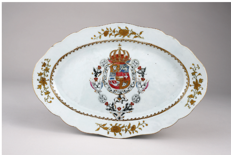
Fig. 6. Oval fruit bowl, 1750–1752, porcelain, China [Staatliche Schlösser, Gärten und Kunstsammlungen Mecklenburg-Vorpommern, Schwerin]

design. On the other hand, Christian Louis attached great importance to the demonstration of the royal Order in another medium of princely representation. For instance, he had two porcelain services produced in China; and all the pieces — fruit bowl, lids, covered tureens, hot dishes, sauce boats or salt cellars — were emblazoned with the Order of St. Andrew alongside the Order of the Elephant. Only forty-nine pieces of the original set of two hundred have survived until today; these are held in the crafts collection of Schwerin Museum (Fig. 6) 33 .