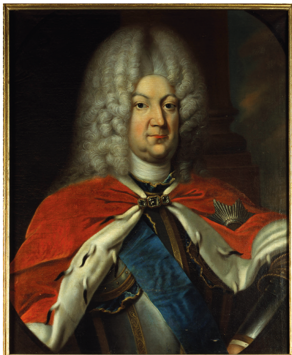
Fig. 2. German, Duke Charles Leopold of Mecklenburg, around 1740, oil on canvas, 76 × 62 cm