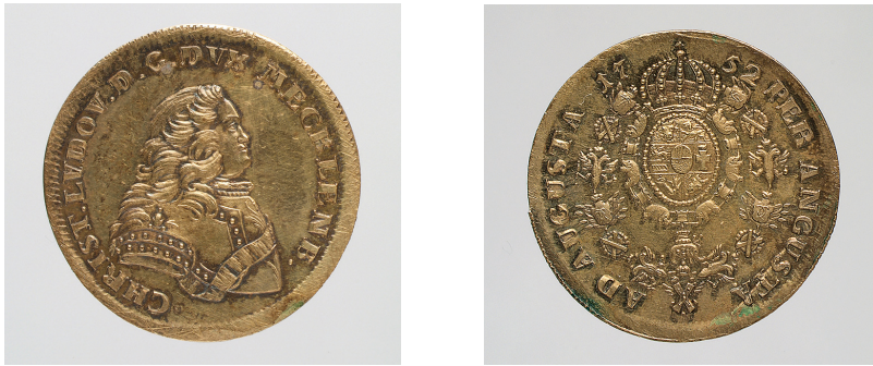
Fig. 5. Duke Christian Louis II of Mecklenburg-Schwerin, 10 ducats, 1752, gold, diameter: 26.7 mm [Staatliche Schlösser, Gärten und Kunstsammlungen Mecklenburg-Vorpommern, Schwerin]

At first glance, the coins, which in general Christian Louis only had minted since 1752, look very similar. 30 On the reverse side, the Orders are depicted “properly” as on the medals. But a careful examination of the portraits on the obverse side reveals only one Order. In the 1752 pieces there is one Order sash; in later issues there is also the star of the Order of the Elephant. According to Carl Friedrich Evers (1729–1803), the ¼ ducat of 1756 was entirely without any Order symbols; 31 however, here the founder of Mecklenburg numismatics was wrong because even on this tiny coin (diameter 13.3 mm) the aforementioned star is present. On the reverse too, the coat of arms (plus Order) is not shown, only the denomination with the year of minting and motto — in other words, absolutely no reference to the Order of St. Andrew, as early as 1756, seven years after the admission to the Order.