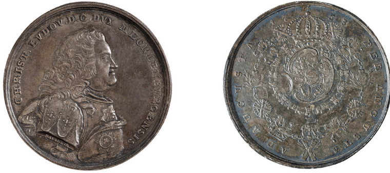
Fig. 4. Duke Christian Louis II of Mecklenburg-Schwerin, medal, 1753, silver, diameter: 46 mm [Staatliche Schlösser, Gärten und Kunstsammlungen Mecklenburg-Vorpommern, Schwerin]

the conscience 26 . Framing his face with a full-bottomed wig and the collar of the Order ensures a constant shift of focus between the Order and the eyes fixed on us, and emphasises the unity between the individual and the exclusive community; by contrast, all the other elements of the painting are secondary. Nonetheless, regardless of how much the Duke valued the Russian Order, he was not entirely indifferent to the Danish one which is shown in the work of an unknown artist 27 . Strictly speaking, only the blue sash of the Order of the Elephant should be visible beside the Order of St. Andrew in this portrait, however, the painter applied his artistic expertise and reduced the size of the sash, setting the Elephant higher and positioning it closer to the edge of the painting.