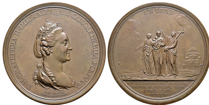
Fig. 10. Tsarina Catherine II of Russia, medal commemorating the birth of her grandson Konstantin, 1779, bronze, diameter: 64.7 mm [Fritz Rudolf Künker GmbH und Co. KG, Osnabrück, auction 251 on 3 rd July 2014, Lot No. 3897]

medals that he could compile a “Histoire métallique” 44 . Perhaps he had served in Russia before his time in Prussia since his work was dedicated to Tsarina Catherine II (1762–1796) (Fig. 9). Alternatively, it might have been related to the fact that he had worked in Poland since 1752. Russia was a strong presence in the aristocratic republic — without Russian consent no important decisions could be taken 45 . Tiregale acted as an architect and surveyor there. Using precise measurements, in 1762 he presented a map of Warsaw, which was later much copied 46 . In connection with this, he also created detailed drawings of buildings that were extremely helpful in the process of rebuilding the city after the Second World War.