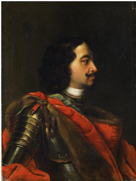
Fig. 1. Johann Kupetzky, Tsar Peter I of Russia, oil on canvas, 85 × 62 cm [Staatliche Schlösser, Gärten und Kunstsammlungen Mecklenburg-Vorpommern, Schwerin]

The relationships between Mecklenburg and Russia culminated in Duke Charles Leopold of Mecklenburg-Schwerin (1713–1747) marrying Catherine Ivanovna (1692–1733), niece of Tsar Peter I (1672–1725), in April 1716 18 . As part of the celebrations for this event, the Duke of Mecklenburg was admitted to the Russian Order of St. Andrew (Fig. 2) 19 .