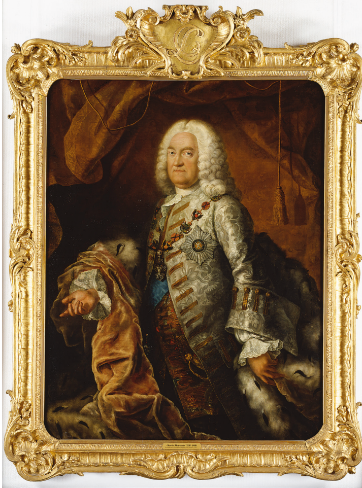
Fig. 3. Charles Maucourt, Duke Christian Louis II of Mecklenburg-Schwerin, 1752, oil on canvas, 142 × 110 cm [Staatliche Schlösser, Gärten und Kunstsammlungen Mecklenburg-Vorpommern]

What could be better suited to visualising his new rank than an official portrait? So Christian Louis commissioned it to the French painter Charles Maucourt (1718–1768) who had previously worked at Strelitz. Maucourt painted the duke as if the Order of St. Andrew alone gave him legitimacy and made him a prince (only the blue sash of the Order of the Elephant can be seen, the “Elephant” is barely recognisable) (Fig. 3) 25 . The complete decoration of the Order of St. Andrew consisted of the three elements: a badge, a collar and a star. This delicately painted star signifies it all: it marks the centre of the portrait, and at the same time marks the heart (of the duke) as the seat of the soul and