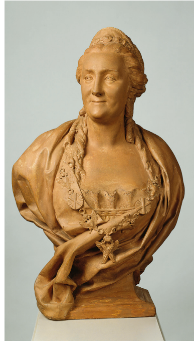
Fig. 11. Jean-Antoine Houdon, Tsarina Catherine II of Russia, 1773, plaster cast [Staatliche Schlösser, Gärten und Kunstsammlungen Mecklenburg-Vorpommern, Schwerin]

By autumn 1945, if not earlier, every Mecklenburger must have known about the Third Rome when the German version of Eisenstein's (1898–1948) "Ivan the Terrible" was released. The first screening took place in Schwerin's "Capitol" on 3 October (newspaper "Volkszeitung" dated 3 rd October 1945). The dubbing of the Russian film was directed by Wolfgang Staudte (1904–1984), one of the greatest German film directors of the post-war period 50 . In the film, the young tsar passionately recounts — twice — the familiar words: "Two Romes have fallen, But the Third Rome stands. And a fourth there shall not be".