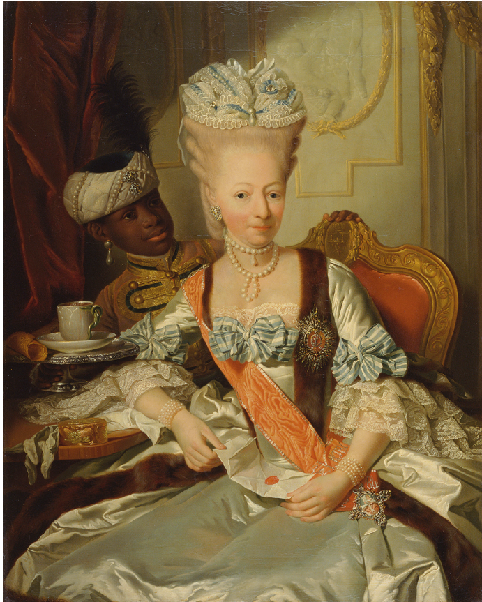
Fig. 7. Georg David Matthieu, Duchess Louise Frederica of Mecklenburg-Schwerin, 1772, oil on canvas, 88 × 72 cm [Staatliche Schlösser, Gärten und Kunstsammlungen Mecklenburg-Vorpommern, Schwerin]

to indicate the duchess' liking for the then newly-popular hot drink) 36 , the details selected by the painter can be interpreted in several different ways. The extent to which the letter she is holding is supposed to demonstrate her witty and open-minded attitude is not so much of interest here. It is, after all, insignificant in the representation of royal power — the Russian Order of Saint Catherine alone is a fitting symbol. Louise Frederica wanted to show the world that she belonged to this imperial community 37 . Other aristocratic ladies from Mecklenburg had been members of the Order before her, for instance, her sister-in-