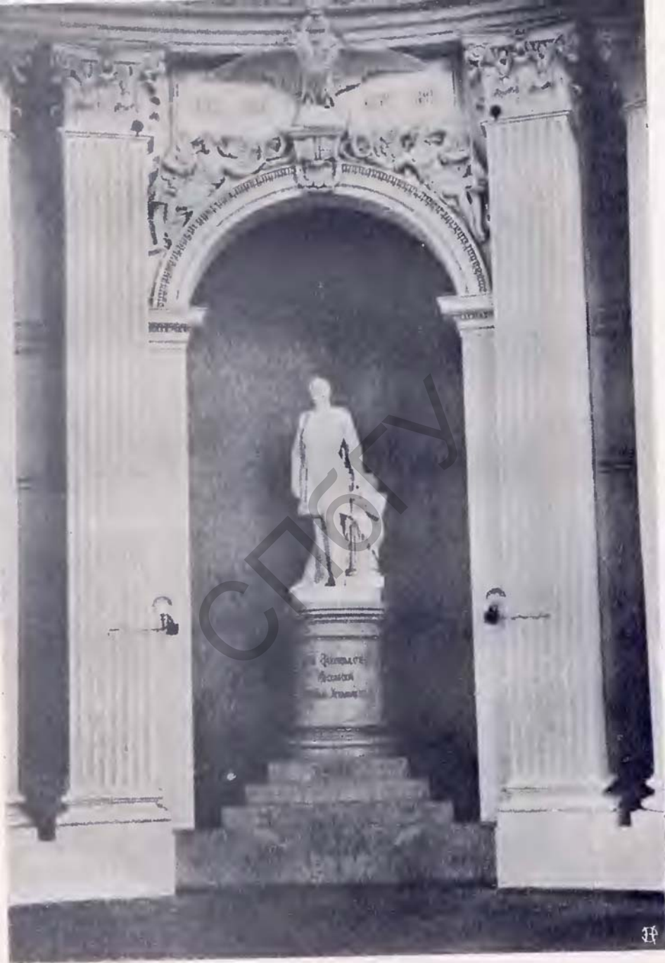
Памятник Императору Александру II въ круглой залѣ Московскаго Окружнаго Суда.