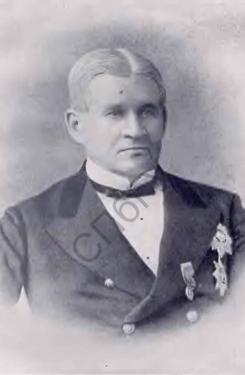
Министръ Юстиціи Дмитрій Николаевичъ Замятнинъ.