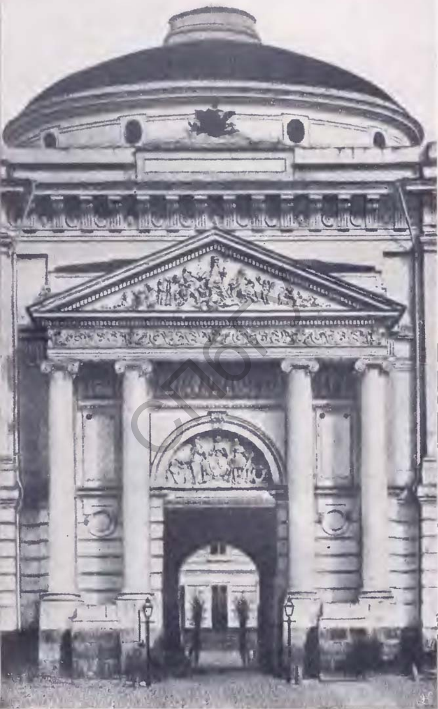
Ворота здания Московских судебных установлений.