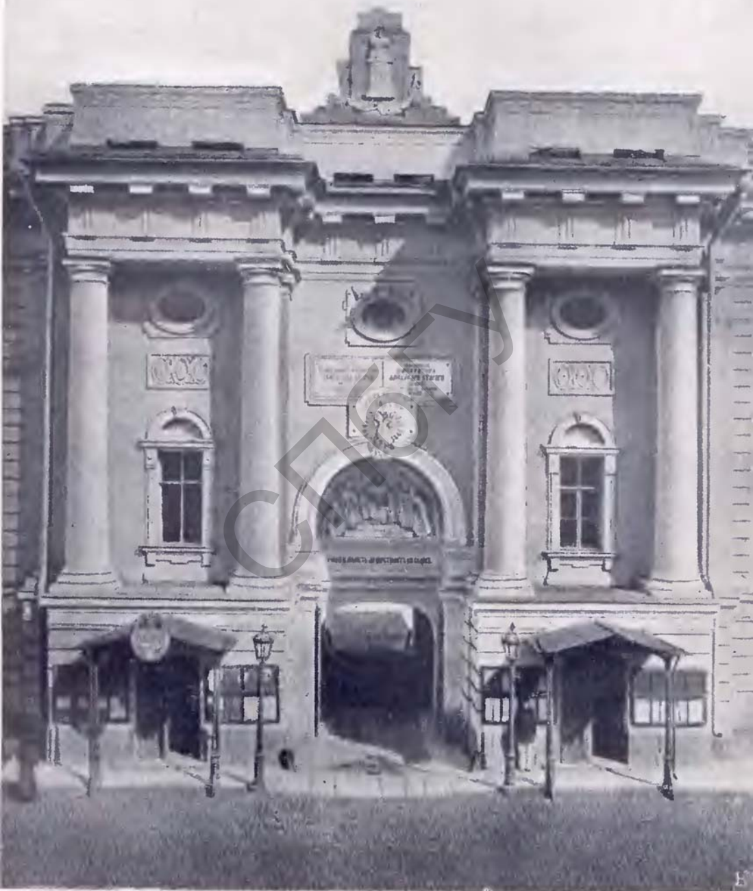
Ворота здания Петроградских судебных установлений.