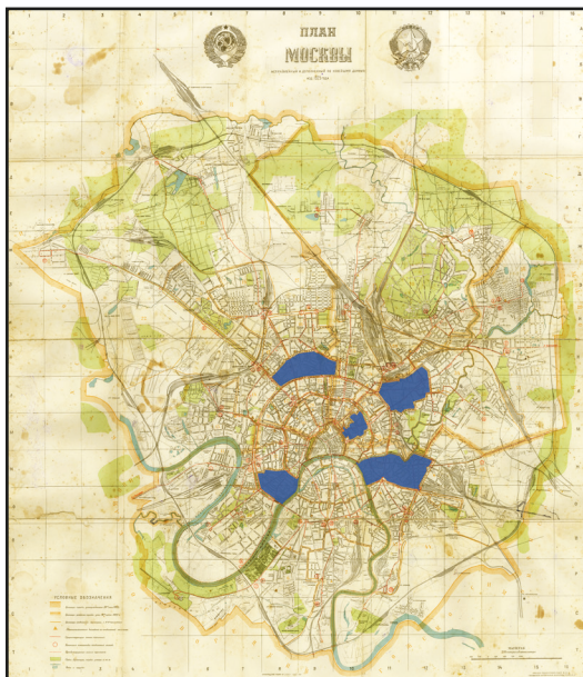
Рис. 1. План Москвы 1925 г. с пятью выделенными отделениями милиции, которым принадлежали выбранные домовые книги в 1918–1921 гг. (источник: План Москвы исправленный и дополненный по новейшим данным изд. 1925 г. URL: http://retromap.ru/m.php?r=0619251&z=13&y=55.784851&x=37.638876 (дата обращения: 21.10.2017))