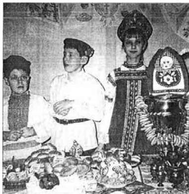
Чаепитие с баранками на ярмарке

Хорошо известны слова припева лирической песни «Москва златоглавая» (авторы не известны), в которой упоминаются баранки: