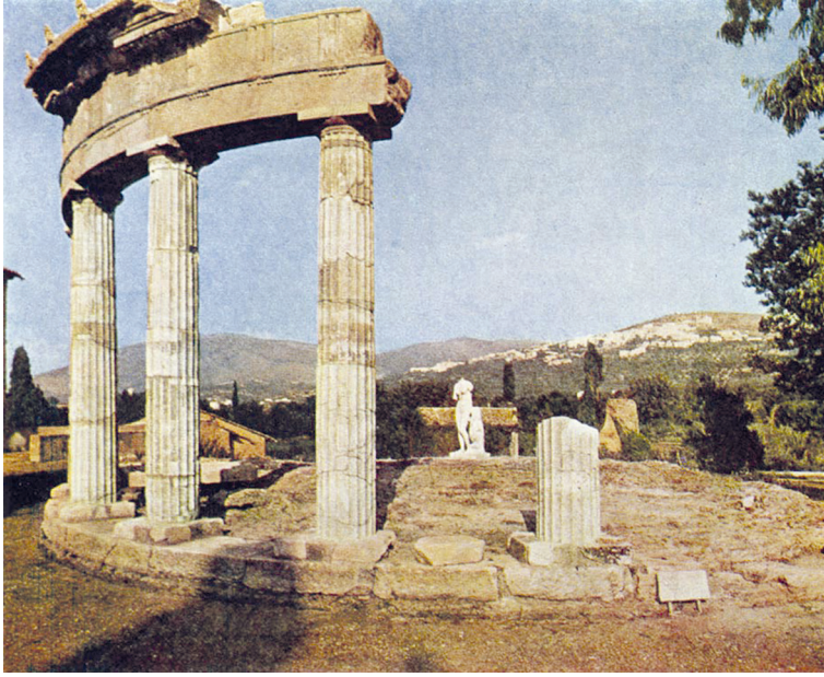
Рис. 2. Храм Венеры. Вилла императора Адриана. Тибур. II в. Современный вид. URL: http://ancientrome.ru/art/artwork/img.htm?id=1928