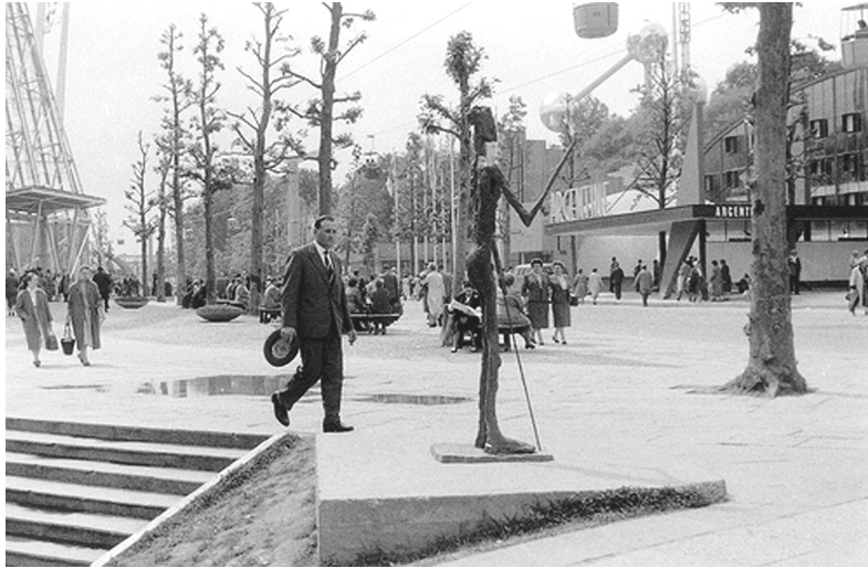
Рис. 10. Всемирная выставка в Брюсселе. 1958 г. URL: https://humus.dreamwidth.org/8563718.html?style=site&thread=30413574

В период с конца 1920-х по 1950-е годы, прерванный в 1940-е годы, в облике интерьеров и экстерьеров всемирных выставок произошли радикальные концептуальные изменения. Вопреки сохраняемому ансамблевому принципу и традиционным планировочным схемам с сильной продольной осью, их пространственные структуры показали окончательный поворот передового русла творческих поисков от классики к модернизму. И в самих пластических формах, и в их комбинациях начали сочетаться экспрессия и экономность, вплоть до сведения массы к экстравагантной остроте конструкций, к знаковости того, что выйдет за пределы изобразительности в чистую выразительность монументально-декоративного искусства и будет названо предельно обезличенно — работами, художественными жестами, артефактами, арт-объектами и т. д. (рис. 10).