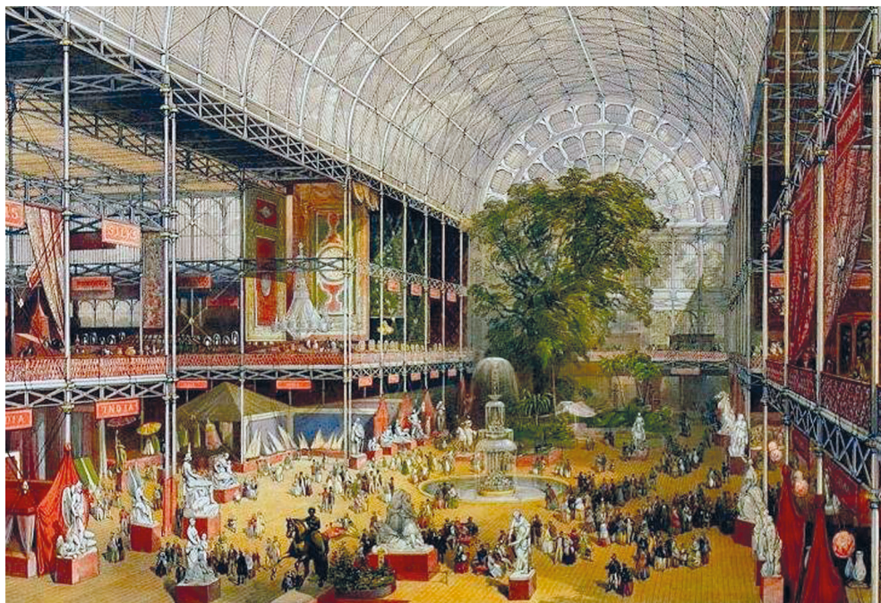
Рис. 8. Хрустальный дворец, 1851 г.