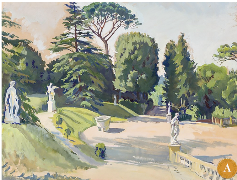
Рис. 4. З.Е.Серебрякова. Сады Боболи во Флоренции. 1932 г. URL: https://antikvarus.ru/aukcionnye-doma/auctionata/auction-no-364-art-from-russia-and-eastern-europe19th-20th-century/sady-boboli-zinaida-serebrakova-1932-g/?AuctionLot_page=11

Дж. да Болонья, навеянные «Метаморфозами» Овидия, вживлены в причудливые, практически вылепленные вручную каскады парка Медичи в Пратолино; туфовые монстры из «Неистового Роланда» Ариосто рассеяны по лесистым склонам парка виллы Сакро Боско в Бомарцо и т. д. (рис. 4).