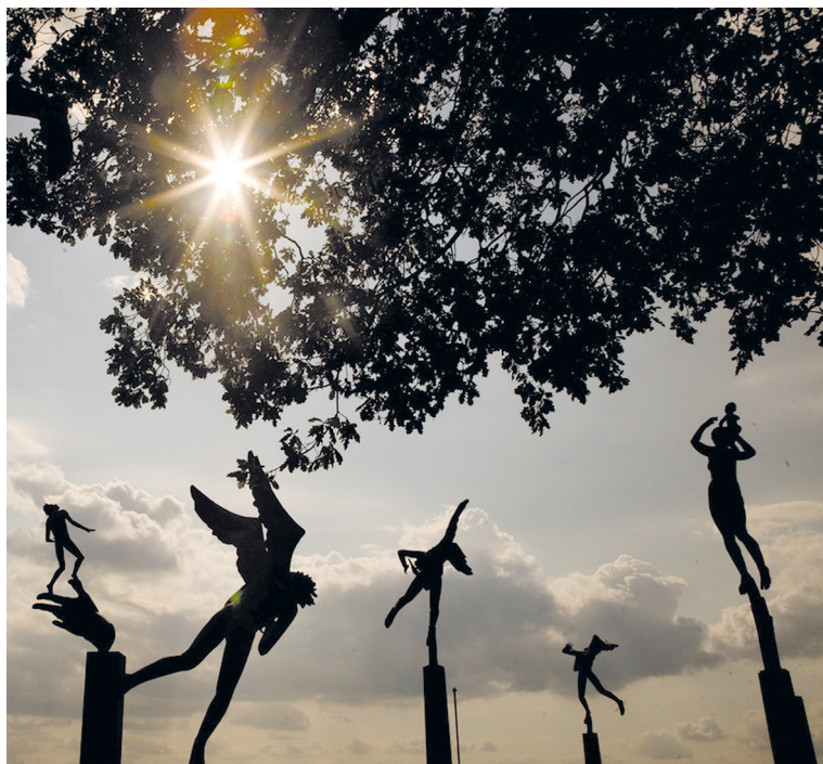
Рис. 1. Парк скульптуры Миллесгорден. Стокгольм. https://poputno.info/places/muzei-cheti-rnadsati-ostrovov-gid-po-stokgol-mu-3/

Для отечественного научного знания хорошо известные парки скульптуры скорее новый объект исследования, хотя еще в 1980-х годах И. В. Иванова видела