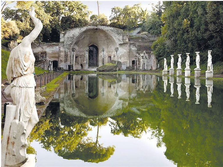
Рис. 3. Канопа. Вилла императора Адриана. Тибур. II в. Современный вид.

существенный лирический акцент (рис. 2); ритмическая конфигурация Канопы, самого интимного участка парка, символически воспроизводящего одноименное место гибели Антиноя в дельте Нила, — одна из доминант (рис. 3). Вопреки потере подавляющего числа элементов, эта конфигурация продолжает представлять метафорический контекст биографии Адриана, а также удерживать большой,