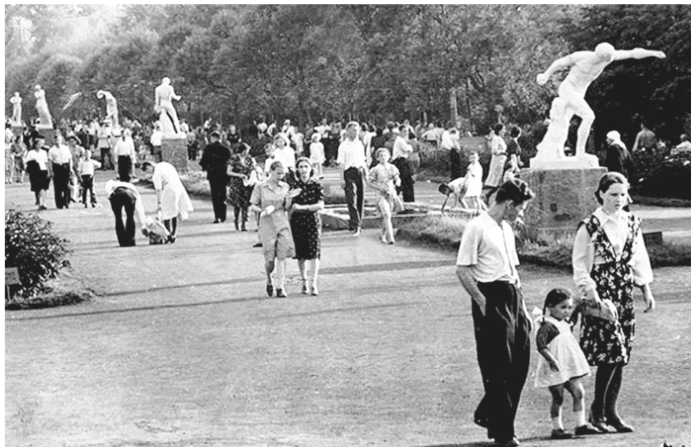
Рис. 11. Аллея физкультурников в парке Горького. Москва. 1930-е годы. URL: https://www.retromap.ru/show_pid.php?pid=76999

монументально-декоративными интерпретациями. Материализуясь, натягивая воочию ту «сетку координат, при посредстве которых люди воспринимают действительность и строят образ мира» [39, с. 105], она безоговорочно превалировала над резонами композиционного развития примыкающих парковых участков, отрываясь от них и образуя самодостаточные объекты в объектах.