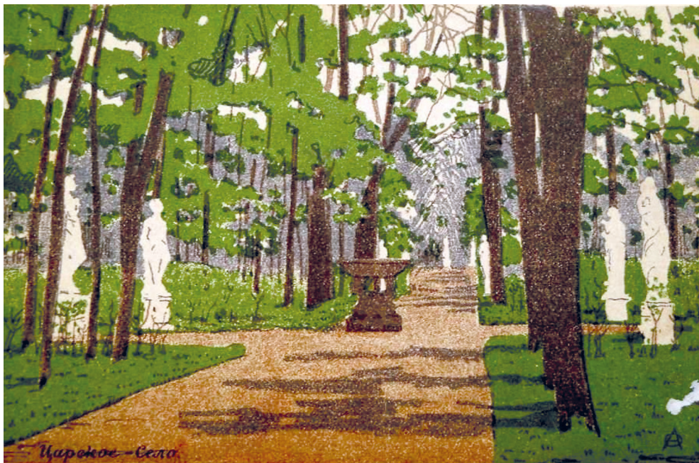
Рис. 6. А. П. Остроумова-Лебедева. Царское село. 1910-е годы. URL: https://viomiro.livejournal.com/524727.html

ции городского населения произведениям синтеза предстояло, с одной стороны, сыграть «важную роль в соединении разных сословий и преодолении розни между ними» [33]; с другой — заставить «приобщиться к культуре, литературе, искусству все большее количество народа» [34, с. 8].