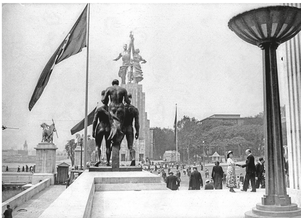
Рис. 9. Всемирная выставка в Париже, 1937 г. URL: https://imgur.com/gallery/vKcQ9