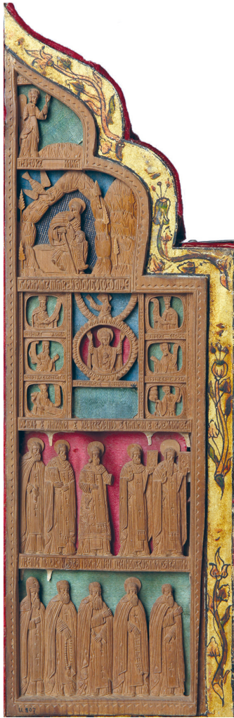
Рис. 6. Складень-триптих. Святой Феодор Стратилат в житии. Праздники и святые. 1680 г. Левая створка. Украинские резчики. Государственный Русский музей