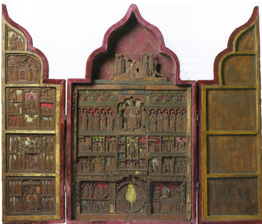
Рис. 2. Складень-триптих. Святой Феодор Стратилат в житии. Праздники и святые. 1680 г. Украинские резчики. Государственные Музеи Московского Кремля

с. 39, 41, 78]. Как особая «икона в иконе» в праздничном ряду этого монументального произведения помещена композиция «Святой Феодор Стратилат со сценами мучений». Эта композиция почти дословно повторена и на складне из Русского музея.