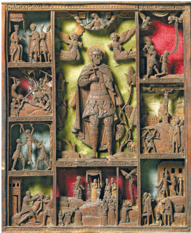
Рис. 5. Складень-триптих. Святой Феодор Стратилат в житии. Праздники и святые. 1680 г. Средник. Украинские резчики. Государственные Музеи Московского Кремля

вариант — фронтальный образ в среднике, сопровождаемый житийными клеймами 9 .