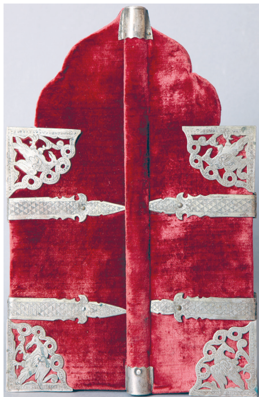
Рис. 3. Складень-триптих. Святой Феодор Стратилат в житии. Праздники и святые. Обратная сторона. 1680 г. Украинские резчики. Государственный Русский музей

Большой и малый складни очень похожи: трехстворчатые, правильных пропорций, со множеством миниатюрных композиций, они исполнены из кипариса в технике многопланового прорезного рельефа. Под изображения подложены цветные фоны. По конструктивным, техническим и художественным особенностям, приемам резьбы этим произведениям близок еще один памятник из кремлевского собрания — так называемый складень патриарха Никона, датируемый исследователями 1650–1660-ми годами 5 .