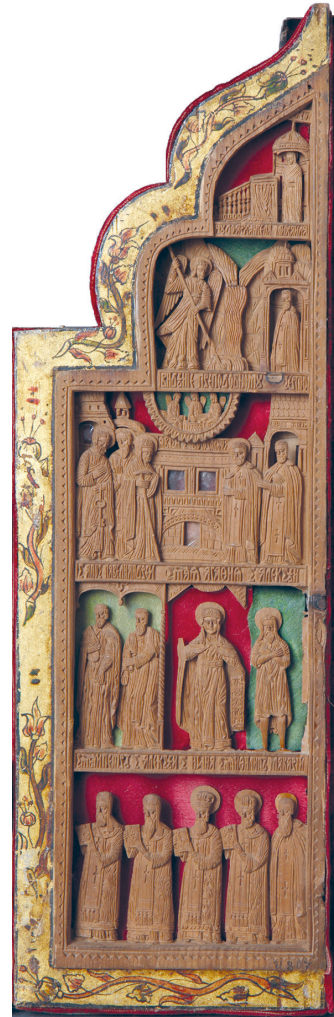
Рис. 7. Складень-триптих. Святой Феодор Стратилат в житии. Праздники и святые. 1680 г. Правая створка. Украинские резчики. Государственный Русский музей

Великий, Григорий Богослов, Иоанн Златоуст, Никола, преподобный Иосиф; преподобные Зосима и Савватий, Пафнутий, Савва и Макарий. На полях оброном резаны надписи.