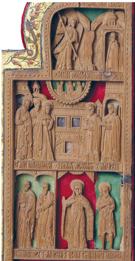
Рис. 8. Складень-триптих. Святой Феодор Стратилат в житии. Праздники и святые. 1680 г. Фрагмент правой створки. Украинские резчики. Государственный Русский музей

Святая Агафия изображена на складне в длинном платье и плаще, сколотом на груди, голова покрыта платом, двумя концами спускающимся на плечи. Плат задрапирован искусными складками. В правой приподнятой руке святая держит мученический крест (не сохранился), в левой опущенной — развернутый свиток с надписью: «Верую во единого Бога». Подобная иконография мученицы с развернутым свитком, содержащим текст Символа веры, восходит к образу святой Параскевы Пятницы. Необычным для древнерусского искусства следует признать появление мимики на лице святой. Улыбка Агафии — новое, неизвестное на Руси веяние европейского искусства.