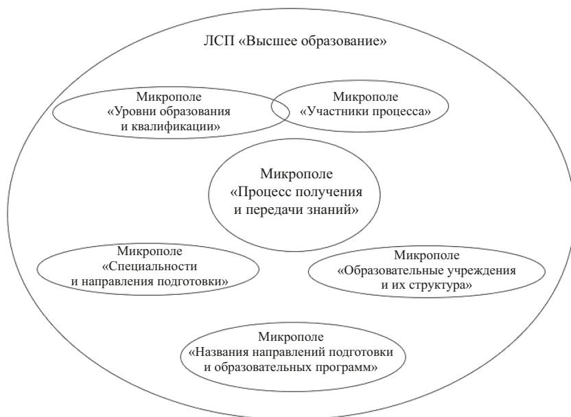
Рис. 1. ЛСП «Высшее образование»