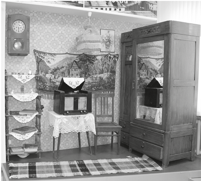
Рис. 10. Интерьер комнаты в первых жилых домах. Фрагмент экспозиции «Юный город на древней земле». Кстовский историко-краеведческий музей, 2017 г.

рез аскетичные интерьеры палатки и конторы Управления начальных работ на экспозиции (рис. 9).