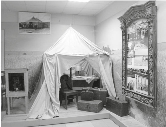
Рис. 9. Интерьер палатки. Фрагмент экспозиции «Первостроители». Кстовский историко-краеведческий музей, 2017 г.