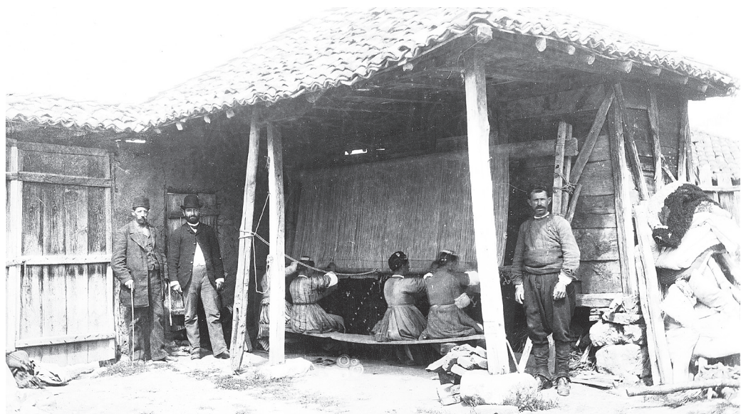
Рис. 3. Тканье килима в Пироте, конец XIX века (Б. Станојевић)

Пиротские килимы ткались на вертикальном ткацком стане, который по типу конструкции отличается от сельских горизонтальных станков. Стан был четырехугольной формы и состоял из правой и левой вертикальных балок, верхнего и нижнего поперечных валов – кросен. Распор фиксировался при помощи «повратила» и «запонки». В конструкции ткацкого стана имелось несколько кругляков для затягивания основы – «заглавци». Уток сбивался при помощи «тупице» – деревянного