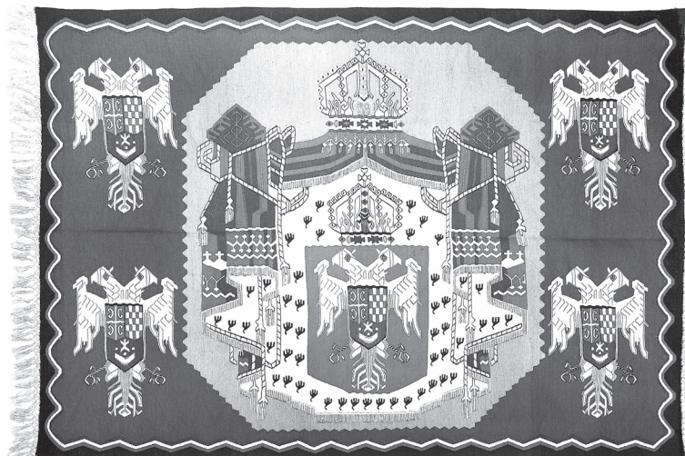
Рис. 4. Килим, Югославская корона, Пирот, первая половина XX века. Этнографический музей, Белград

Завоевав мировую известность, пиротские килимы стали востребованными элементами интерьера в общественных учреждениях – в банках, музеях, Парламенте, местных муниципалитетах. Ими украшались резиденции высокопоставленного церковного клира. Под заказ пиротские килимы изготавливались и поставлялись в резиденции членов королевских фамилий – Обреновичей и Карагеоргиевичей 36 . Пиротские килимы стали