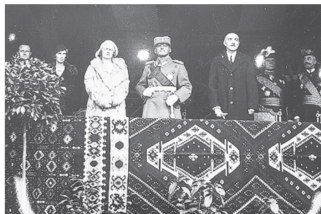
Рис. 5. Король Александр и королева Мария Карагеоргиевичи, 1930 год.

трогательное описание демонстрирует, что использование килимов в таком количестве подразумевало нечто большее, чем просто украшение события. Килимы были материальным и духовным богатством, тем самым французским солдатам было выражено искреннее уважение, признание и симпатия.