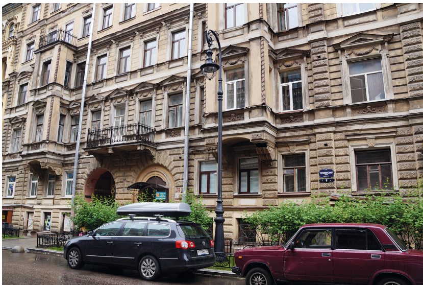
Дом, где собиралась подростковая «Черная кошка». Ленинград, ул. Пушкинская, 8