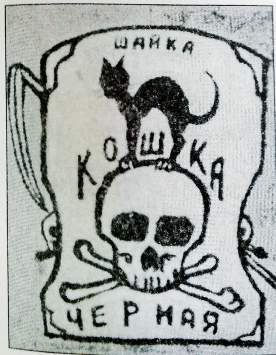
Еще одна записка от имени «Черной кошки» (Тарасов А.Д. Век российского бандитизма. М., 2001. Вклейка)

Конверт с этим рисунком адресат вытащил из ящика для писем