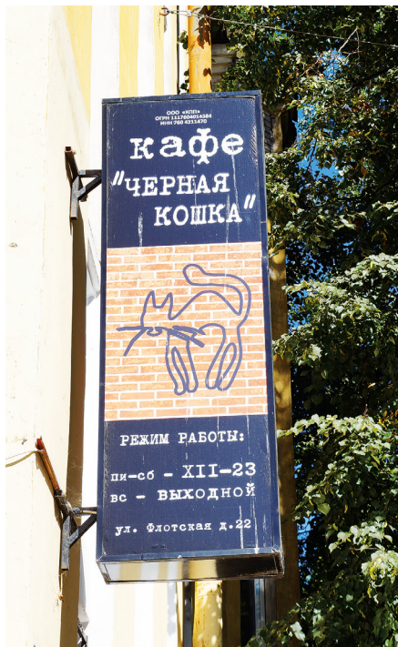
Вывеска у входа в кафе «Черная кошка», г. Ярославль

героев в современном бизнесе. Например, в Ярославле можно пообедать в кафе «Черная кошка», где интерьер заведения выполнен в духе 1950-х гг., на стенах изображены герои, а на вывеске — кошка из знаменитого сериала.