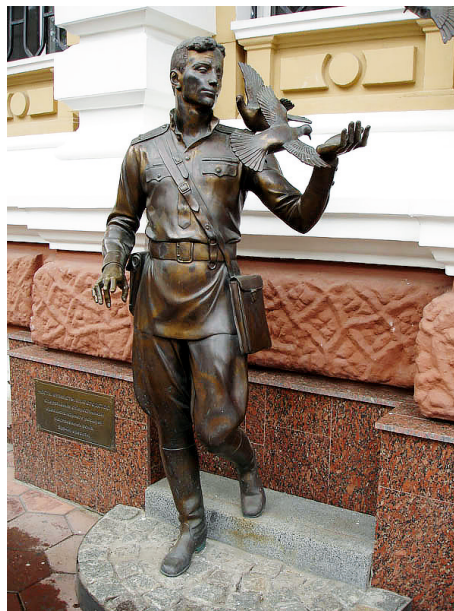
Памятник советскому милиционеру в Одессе на ул. Еврейской

Если обратиться к архивным данным, то становится ясно, что одной из самых страшных проблем послевоенной жизни в СССР был высокий уровень преступности. По данным донесения министра внутренних дел СССР С. Круглова, в 1946 г. ликвидировано 2895 банд уголовников, а также 1196 банд, члены которых использовали в своей деятельности националистические идеи 8 .