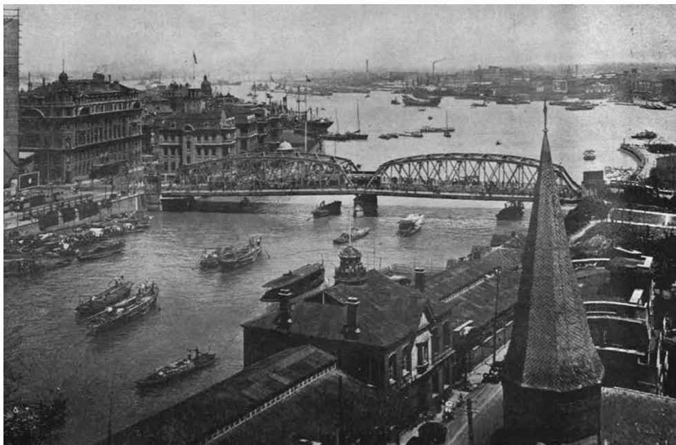
Garden Bridge. На заднем плане слева — советское консульство

на Дальнем Востоке, советское правительство обращало большое внимание на сбор разведывательных данных. В феврале 1946 г. полиция Шанхая заметила активность советских агентов по созданию отделения связи в Шанхае: «Глава шанхайского филиала службы военной разведки СССР Г. М. Голев по поручению генконсула СССР Константинова в данный момент организует секретное отделение связи в Шанхае для получения информации о: 1) деятельности армии США в Шанхае и количестве материальной помощи, оказанной нашей стране; 2) передаче японского оружия; 3) контактах с руководством высшего звена союзнических государств; 4) военных силах нашей армии; 5) участии японской армии в борьбе с коммунистами» 20 .