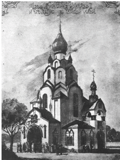
Свято-Николаевский храм

В связи с вышеупомянутыми действиями советской власти в Шанхае китайское правительство не могло не изменить отношения к российским эмигрантам. Поводом для этого стало то, что 30 июня 1947 г. Правительство СССР призвало всех советских подданных в Китае вернуться на родину 57 . Многие эмигранты, получившие советское гражданство в 1945–1946 гг., не желали переселяться в СССР и хотели отказаться от гражданства. Полиция Шанхая сталкивалась с подобными случаями еще в первой половине 1947 г.,