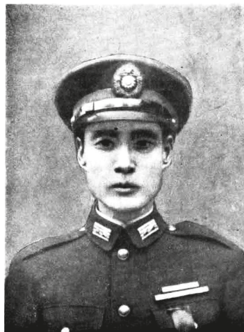
Глава полиции Сюань Те-у