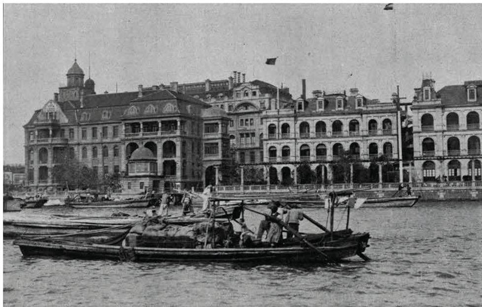
Советское консульство в Шанхае