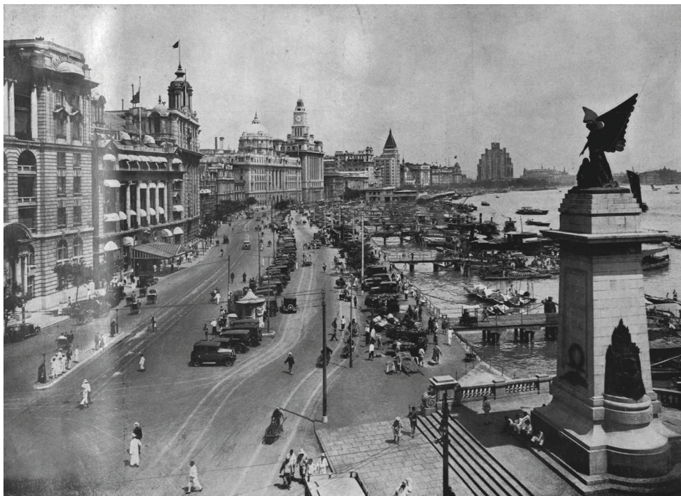
Вид набережной Шанхая

После того как японцы потерпели поражение и в Шанхае остались только китайские власти, изменилась политическая и социальная обстановка для российских эмигрантов 7 .