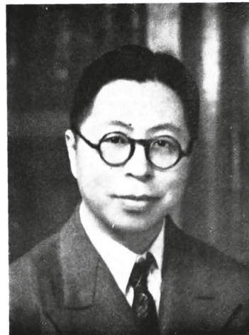
Мэр У Гочжэн