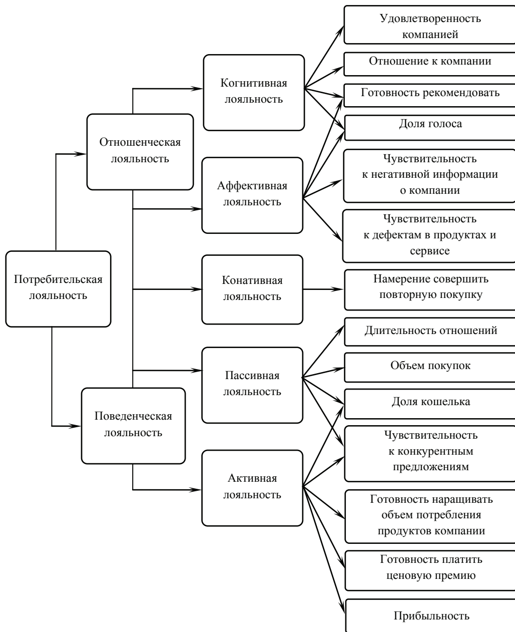
Рис. 1. Виды и проявления потребительской лояльности

Наличие различных видов лояльности, лишь одна из которых может быть желательной для компании, наталкивает на размышления о том, как определить, измерить, а главное — управлять различными видами лояльности для достижения максимального результата.