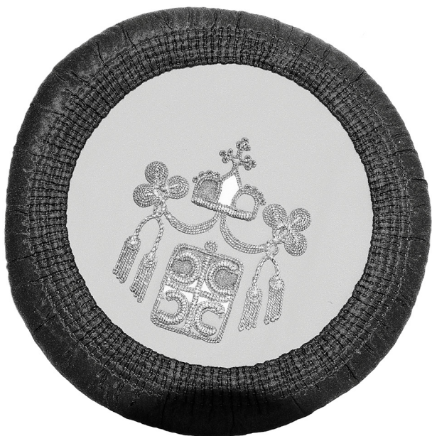
Рис. 6. «Черногорская шапка» с элементами герба Княжества Сербии (1835–1882), компонент костюма. Первая половина XX в. Королевство Югославия. Передана в дар от Славянского комитета СССР в 1947 г. Черногорцы, Югославия. (РЭМ. Колл. № 6521-1)

Обстоятельства попадания данного костюма в музей отразили в себе целый этап истории репрезентации славянского этнокультурного наследия. Востребованность этой репрезентации средствами музейного метаязыка была связана с уроками Второй мировой войны, которые привели руководство СССР к пониманию необходимости укрепления военно-политического и экономического союза со славянскими странами 55 . Особое место в проекте укрепления этих связей уделялось Югославии, рассматривавшейся в качестве центра политической интеграции славянских стран. Планы по взаимодействию в этом вопросе обсуждались на VI Всеславянском конгрессе в Белграде в 1946 г., следствием которого стало развертывание в славянских странах агитационной программы, направленной на идеологическое обоснование создаваемого блока 56 .