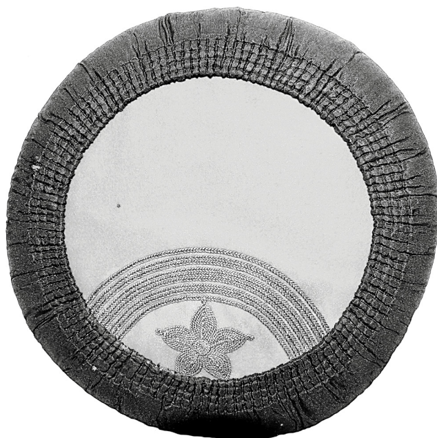
Рис. 2. «Черногорская шапка» с мотивом «звезда», компонент костюма семилетнего мальчика. Конец XIX – начало XX в. Черногорцы. г. Цетинье, Княжество Черногория. Поступила в РЭМ в 1923 г. из Гатчинского дворца-музея. (РЭМ. Колл. № 4058-15)

В источниках второй половины XIX в. сообщается, что звезда, вышитая на шапке, могла быть и шестиконечной. В частности, на фотографическом портрете принца Данилы