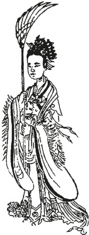
Рис. 7. Нефритовая дева (юй нюй 玉女) с веером [11, с. 461]

Другой отличительной чертой ритуала Тянь синь чжэн фа является обряд изгнания демонов, овладевших человеком. Для этого даос с помощью заклинаний и формул-амулетов призывал себе на помощь армию духов-солдат под командованием одного из божеств-генералов. Следующие за божествами-генералами духи-солдаты ( инь бин 陰兵) — это воинство из потустороннего мира, состоящее из душ умерших, которые в мире мертвых входят в армии более высокопоставленных служителей. Эта армия должна была схватить злого духа и заключить его в Небесную тюрьму ( тянь юй 天獄).