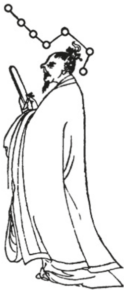
Рис. 4. Даос совершает поклонение высшим божествам ковша (Чжао чжэнь доу 朝真斗) [11, с. 490]