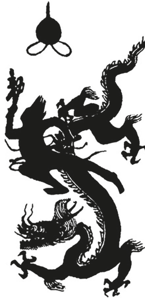
Рис. 2. Формула-амулет истинного обличия Хэй-ша (Хэй-ша чжэнь син фу 黑煞真形符) [11, с. 482]