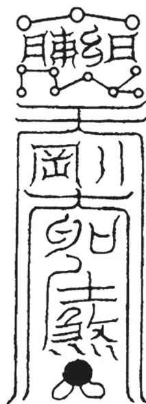
Рис. 5. Формула-амулет Великих совершенномудрых звезд Тянь-ган (Тянь-ган фу 天罡大聖符) [8, с. 254]

лись за помощью во время проведения ритуала даосские священнослужители (рис. 4).