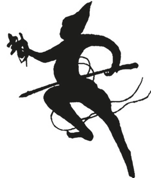
Рис. 3. Формула-амулет для вызова генерала Тянь-пэна 天蓬 [11, с. 413]

жизни, но не упоминает о том, что он знал ритуалы Сердца Небес [4, р. 315]. Тем не менее представители школы Сердца Небес стали почитать его в качестве основоположника своего учения.