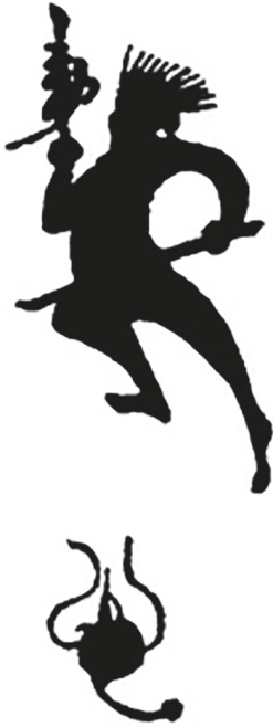
Рис. 1. Формула-амулет Совершенного воина (Чжэнь-у фу 真武符) [7, с. 322]