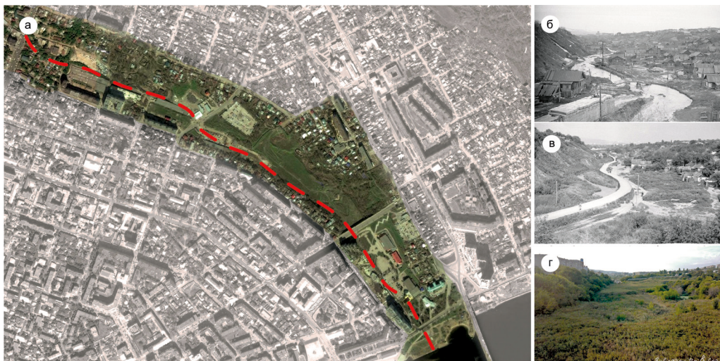
Рис. 1. Ландшафт Глебучева оврага: а — ситуационный план: трассировка коллектора в долине оврага; б — речка Глебовка (Глебучёвка, Тайбалык) в начале XX века; в — коллекторная система, 1961–1963 гг.; г — долина Глебучева оврага, современное состояние: коллектор под толщей строительного мусора, склоны долины застроены многоэтажными домами. Дизайн А. О. Кузьминой

Глебучевку [XVI]. На рубеже XIX–XX вв. в связи с потерей природного вида и загрязнением реки и оврага приняли решение убрать реку в коллектор. С тех пор с каждым годом память о старинной реке Глебучевке безвозвратно утрачивается (рис. 1 а, б, в, г).