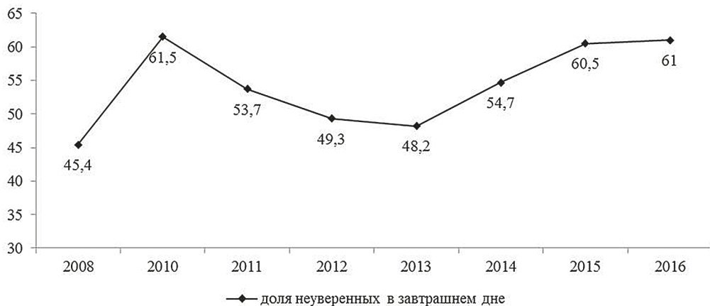
Рис. 3. Доля жителей Вологодской области, сталкивающихся с проблемой неуверенности в завтрашнем дне в 2008–2016 гг., в % от числа опрошенных

Социальная адаптация населения к негативным изменениям окружающей действительности во многом характеризуется таким индикатором социального самочувствия, как степень уверенности в завтрашнем дне. По данным опроса общественного мнения ВолНИЦ РАН, с 2008 по 2016 г. наблюдается рост доли жителей области, не уверенных в завтрашнем дне (на 16 п. п.: с 45 до 61 %), при этом негативная динамика оценок заметна в кризисные периоды (с 2008 по 2010 г. на 17 п. п., с 2013 по 2016 г. — на 13 п. п.; рис. 3). Следует подчеркнуть, что ощущение неуверенности в будущем в годы экономического кризиса характерно для большей части населения (примерно для 50–60 %).