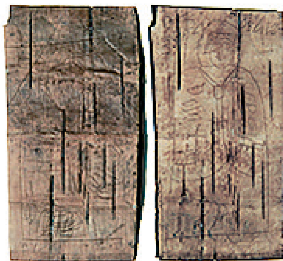
а б Рис. 1. Береста. Изображение Иисуса Христа (на лицевой стороне, а ) и св. Варвары (на оборотной стороне, б ) с датой

Обратимся к палеографическому анализу этой даты (см. рис. 1; изображения приведены по названной статье А. А. Зализняка и В. Л. Янина 2004 г.).