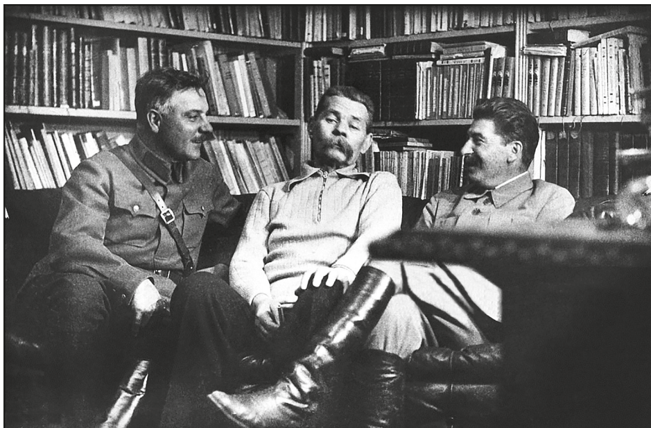
К. Е. Ворошилов, А. М. Горький, И. В. Сталин (1931 г.).

социалистическую культуру. Эти книги — будем надеяться — послужат хорошим средством развития классового, революционного самосознания масс и, вместе с тем, они могут и должны послужить к руководству пролетариатом всех стран» 21 .