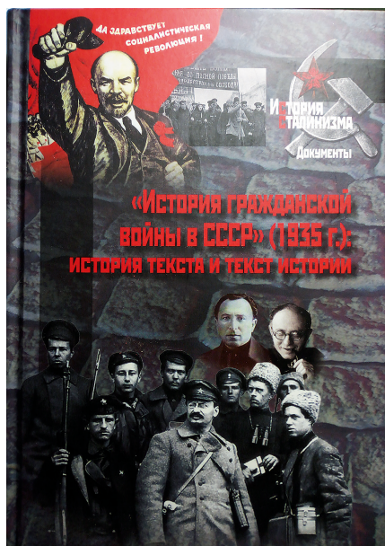
Обложка книги «История гражданской войны в СССР (1935 г.): история текста и текст истории»

Сталиным) концепцию истории гражданской войны в СССР. И кажется невероятным отсутствие каких-либо исследований, отражающих эволюцию названного проекта 3 . В 2017 г. был подготовлен текст «Истории гражданской войны в СССР», изданный в 1935 г., в сравнении с макетом, который редактировал Сталин в 1934–1935 гг., что позволило уточнить динамику сталинского понимания значения революции. В издание включены также документы, раскрывающие трансформацию замысла этого проекта 4 .