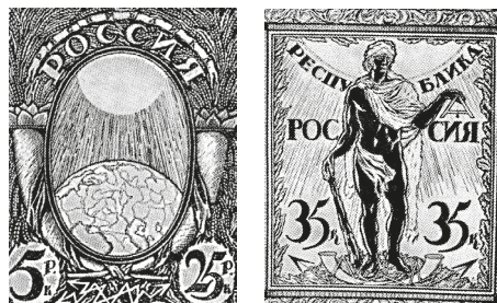
Рис. 2. Проекты марок С. Чехонина (1918)