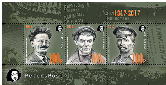
Рис. 23. 2017. Сентябрь. Петерспост. Россия. 100-летие Российской революции. 1917–2017. «Тревожное лето». Почтовый блок из 3 марок. Худ. Олег Ильдюков