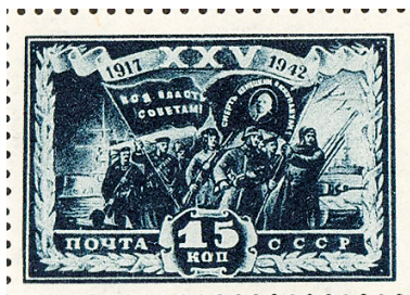
Рис. 12. 1943. Январь. К 25-летию Октябрьской революции. Красная Гвардия и Красная Армия. Худ. П. Алякринский и А. Мандрусов