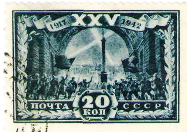
Рис. 11. Январь. К 25-летию Октябрьской революции. Штурм Зимнего дворца в Октябре 1917 г. Худ. П. Алякринский и А. Мандрусов