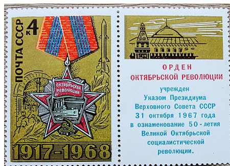
Рис. 19. 1968. Сентябрь. 51-я годовщина Октябрьской революции. Орден Октябрьской Революции. Худ. Л. Шаров