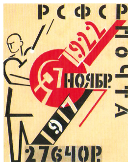
Рис. 7. Проект марки Н. Альтмана (1922)