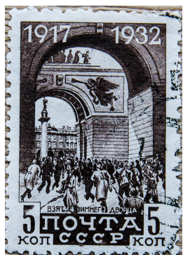
Рис. 10. 1932 (октябрь — ноябрь) — 1933 (март — октябрь). 15-летие Октябрьской революции. Штурм Зимнего дворца 25 октября (7 ноября) 1917 г. Худ. И. Соколов