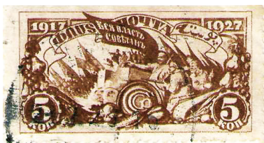
Рис. 8. 1927. Октябрь. 10-летие Октябрьской революции. Символическое изображение вооруженного восстания. Худ. Н. Котов