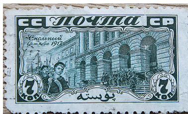
Рис. 9. 1927. Октябрь. 10-летие Октябрьской революции. Смольный в Октябрьские дни. Худ. В. Куприянов, гравёр П. Ксидиас