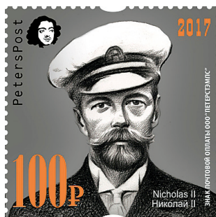
Рис. 22. 2017. Февраль. Петерспост. Россия. 100-летие отречения Российского Императора Николая II от престола. Худ. Олег Ильдюков