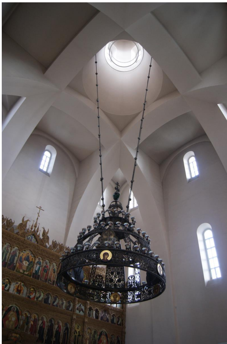
13. Верхний храм Феодоровского собора. Подкупольное пространство.