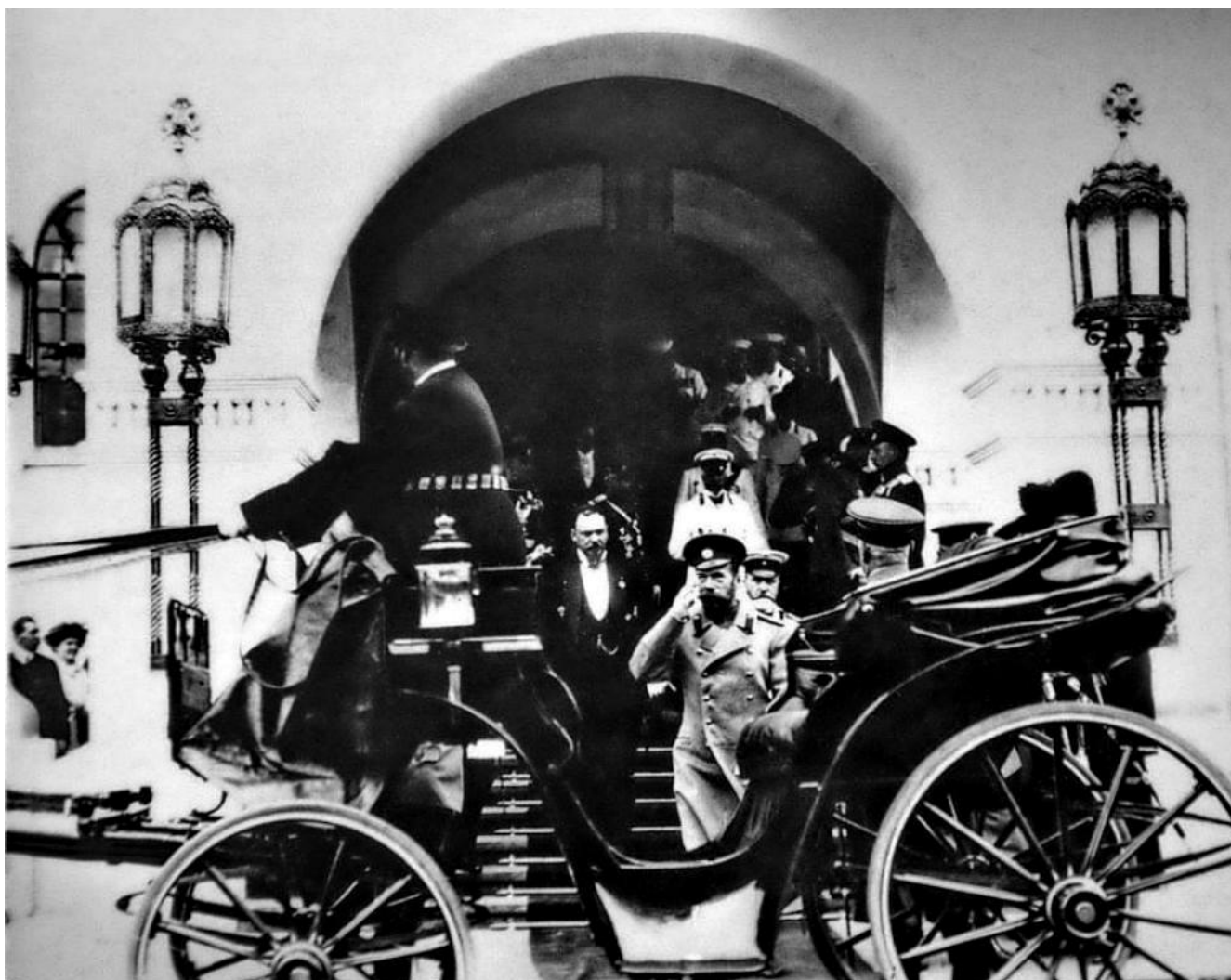
21. Посещение императором Николаем II отделения государственного банка в Нижнем Новгороде. Фото 14 мая 1913 г.