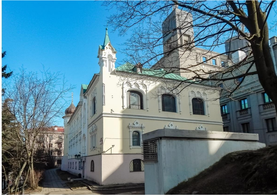
1. Юбилейный дом., В. Струев, 1913г. Минск, Республика Беларусь. Фото 2017 г.