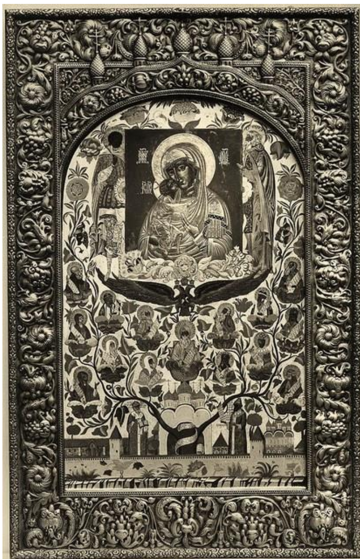
11. Макет майоликового панно, поднесенный Императору Николаю II в день освящения храма 15 января 1914 года. Фото после 1914.