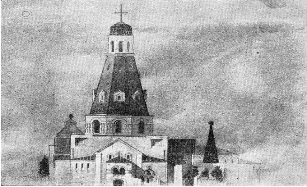
6. Проект Феодоровского собора А.А. Джорогова. Рисунок.