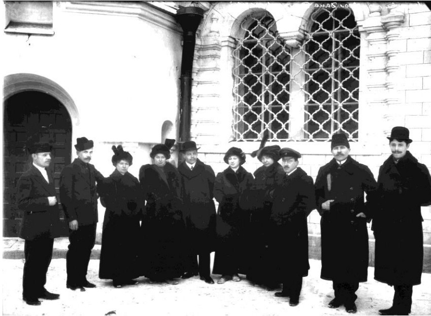
Участники строительного комитета и члены их семей.

4. Участники комитета по строительству Феодоровского собора и члены их семей у Феодоровского собора, С.С.Кричинский, 1911-1913. Фото 1913 г.