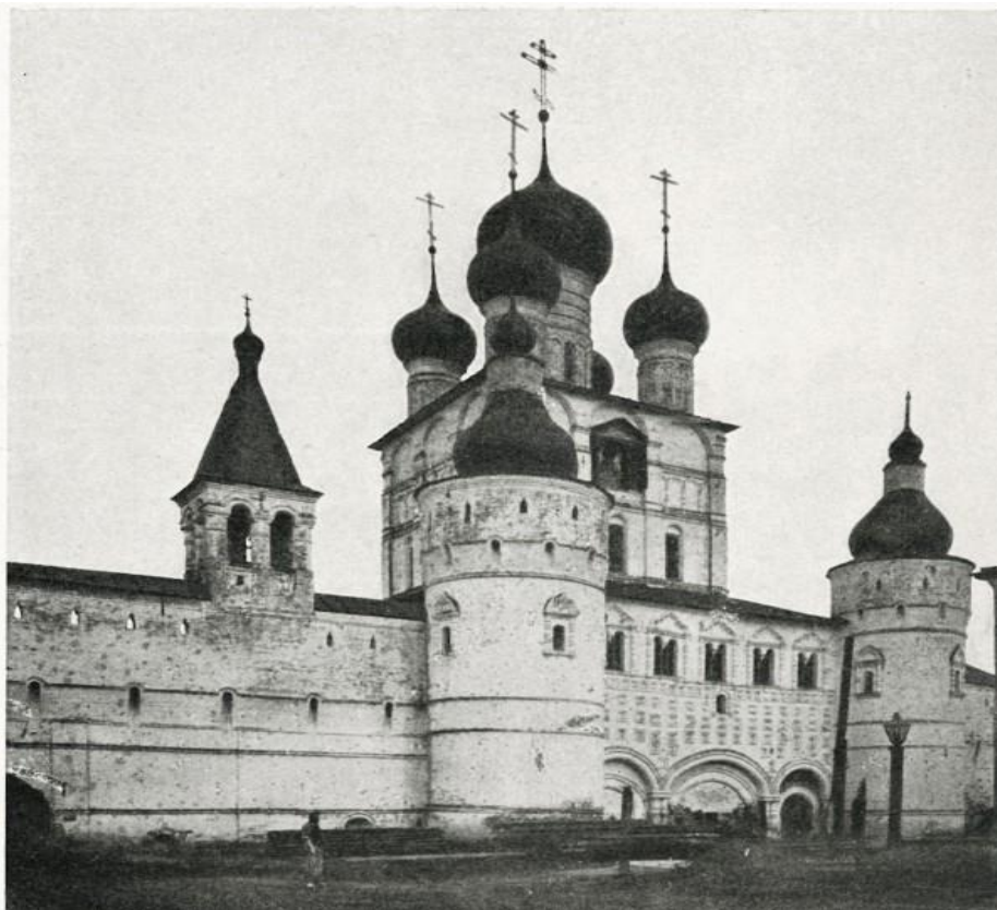
9. Церковь Иоанна Богослова. 1683 г. Ростов Великий.