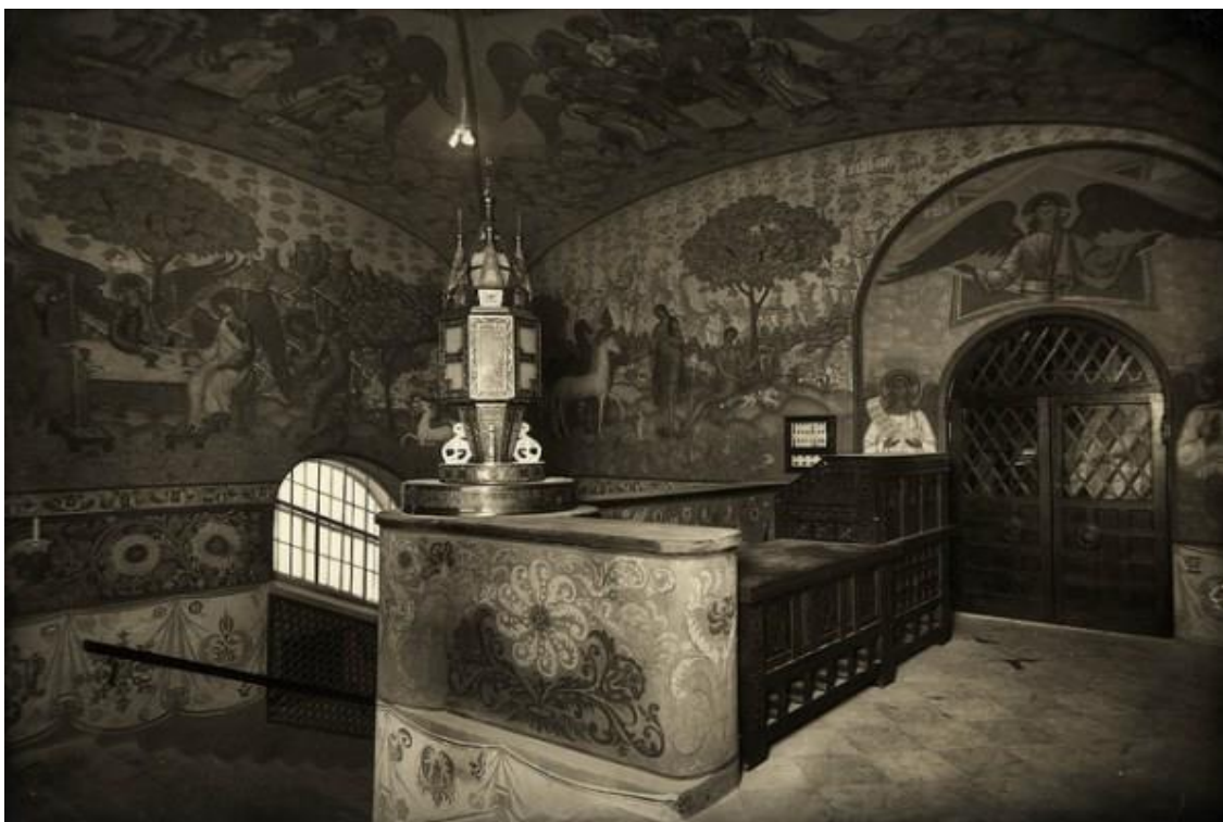
14. Феодоровский собор. Царская лестница. Фото 1914 г.