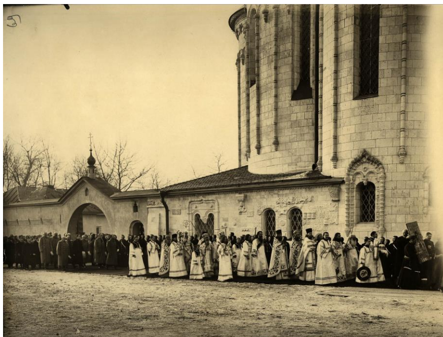
8. Освящение Феодоровского собора. Фото 15 января 1914.