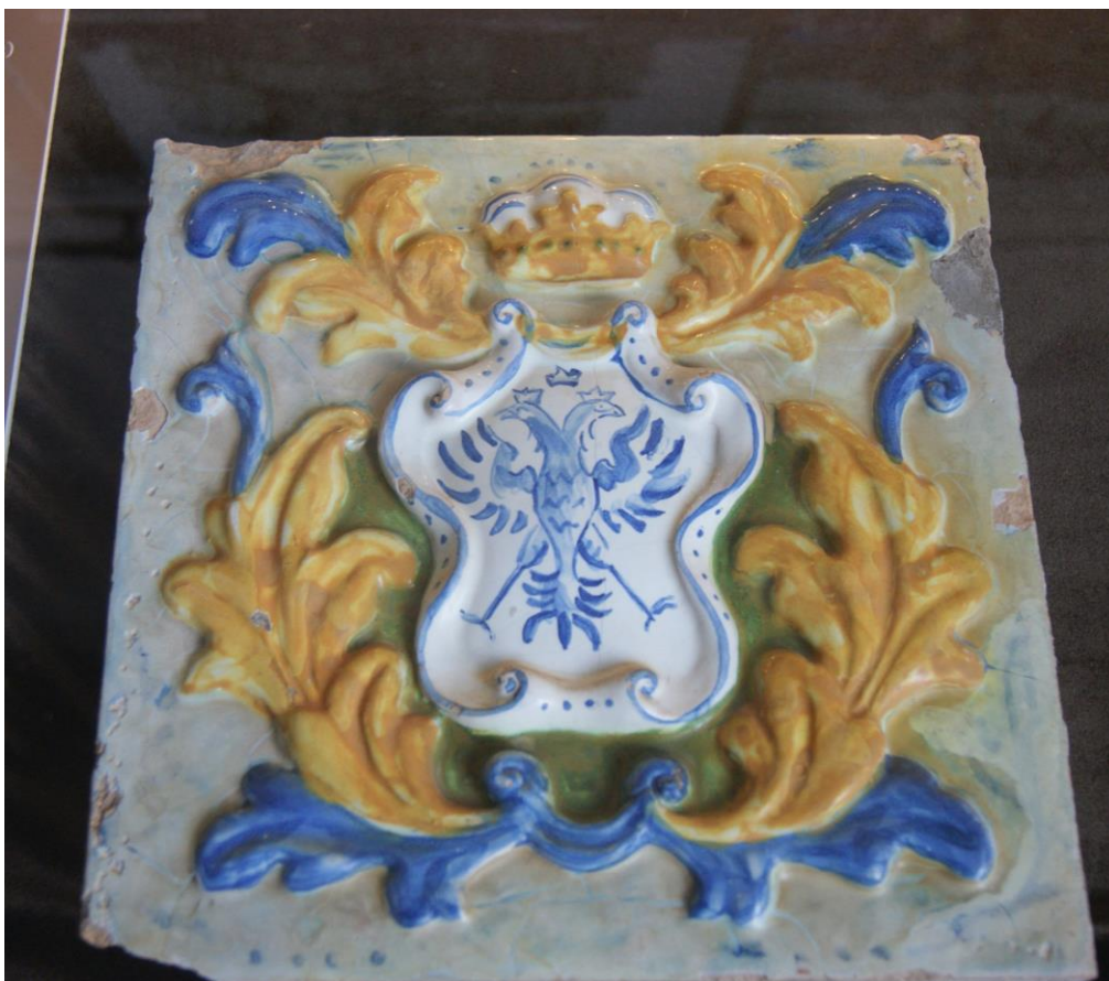
12. Единственный сохранившийся изразец, украшавший фасад храма.