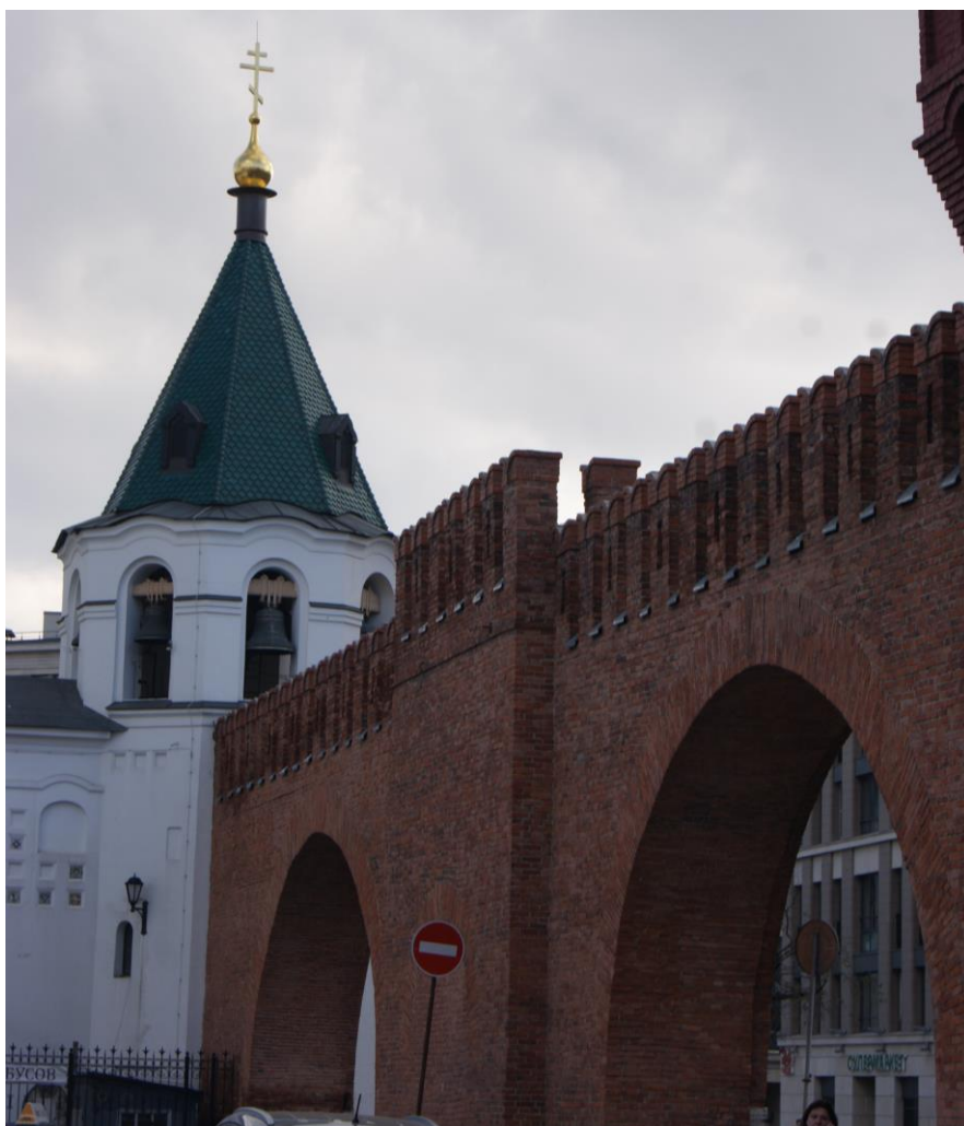
10. Кирпичная стена, арх. С.С.Кричинский, 1913 г. 2018 г.