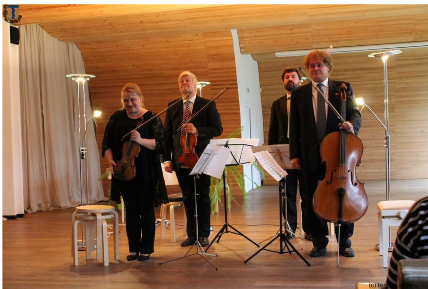
Рис.10. Концерт в библиотеке Аалто https://terijoki.spb.ru/trk_events.php3?item=169%27A=0

«Многие мероприятия мы проводим совместно с нашими социальными партнерами. У нас необычный лекционный зал с акустическим потолком. Надо сказать, что музыканты с мировым именем приезжают для того, чтобы выступить в этом зале, чтобы услышать звучание своих голосов и инструментов. Мы предоставляем свое пространство творческим людям не только Выборга, но и Ленобласти и России, чтобы они могли показать свое творчество. Основные направления деятельности: экологическое воспитание, краеведческая работа, социально-культурная деятельность, продвижение книги и чтения, эстетическое воспитание».