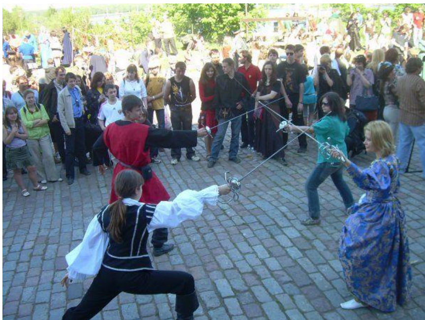
Рис.6. Фестиваль «Майское

дереву» ( https://art-fencing.livejournal.com/15261.html )