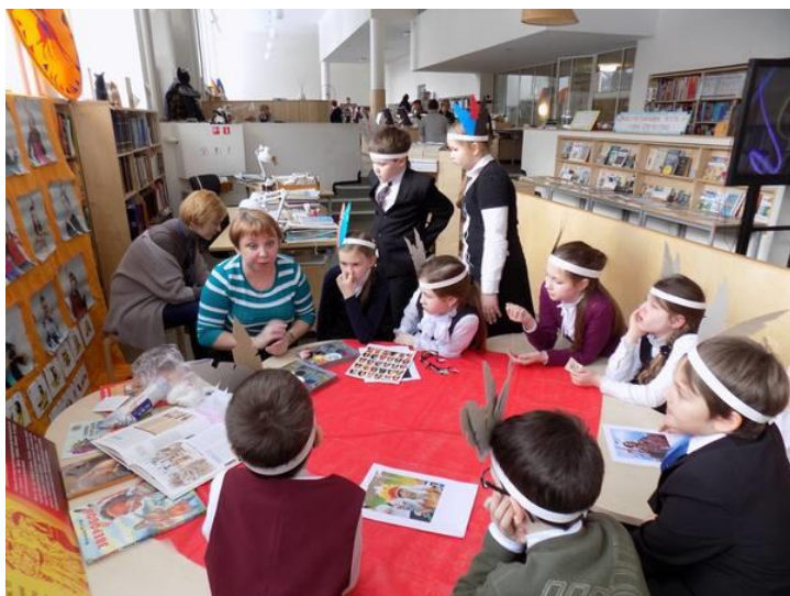
Рис.8. Детское мероприятие в библиотеке Аалто ( https://afisha.sputnik.ru/events/Festival-Knizhniy-ViborG-de4/ )

«Библиотека связана с именем знаменитого архитектора, поэтому к этому зданию всегда был очень большой интерес, и не только у жителей Выборга. Посещаемость библиотеки большая: более 300 000 посещений в год. Книговыдача – более 400 000 в год. Мы проводим 2500 мероприятий в год, более 10-ти мероприятий международного уровня в год. Также на нашей базе проходят региональные мероприятия: фестивали, конкурсы, концерты. В день бывает до 11 различных мероприятий только во взрослой библиотеке. А всего по библиотеке бывает до 20 мероприятий в день».