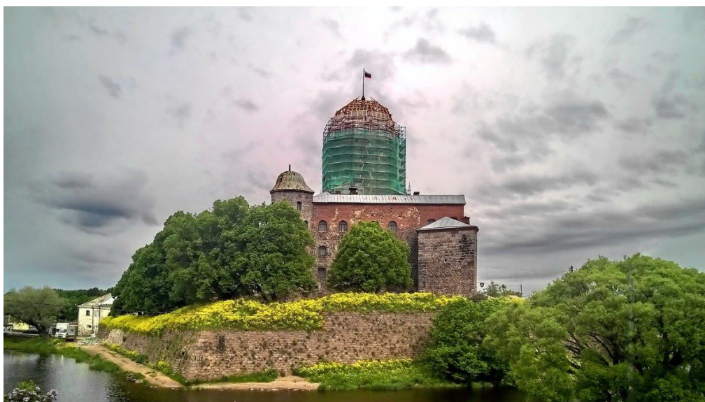
Рис.5. Выборгский Замок на реставрации

Цой В.О.: «В замке много не используемых корпусов. Мы сейчас будем их реставрировать и делать в музей. Здесь будет подписан контракт почти на млрд. рублей. Через 3 года здесь будет суперсовременное выставочное пространство».