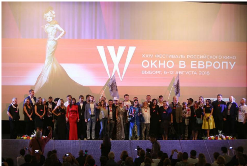
Рис.11. Кинофестиваль «Окно в Европу»

«Из самых популярных фестивалей – Кинофестиваль «Окно в Европу». На базе библиотеки Аалто проводятся мастер-классы режиссеров, деятелей культуры, литераторов. В 2015 году в рамках фестиваля у нас была встреча с Евгением Евтушенко».