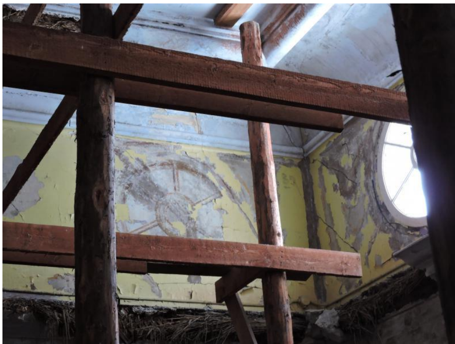
Рис.3. Реставрация музейно-паркового ансамбля «Монрепо» ( http://www.parkmonrepos.org/content/monrepo-restavraciya-prodolzhaetsya )

Тюрми Е.С.: «Библиотека Аалто – это первая ласточка в городе Выборг. Это практически единственное здание отреставрированное, которое является памятником архитектуры. У нас более 300 памятников архитектуры».