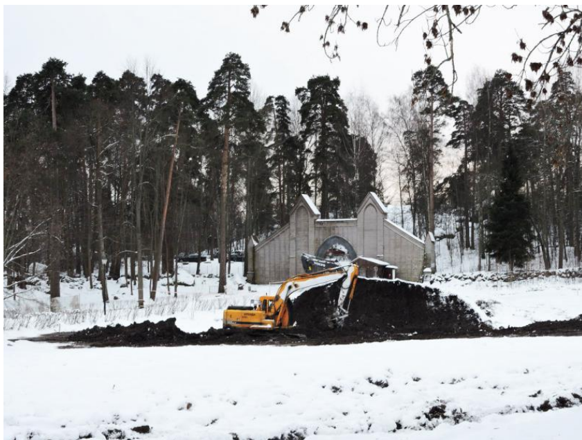
Рис.2. Реставрация музейно-паркового ансамбля «Монрепо» ( http://www.parkmonrepos.org/content/o-restavracii-parka-monrepo )

«Кстати, подробный проект реставрации также размещен на официальном сайте парка Монрепо».