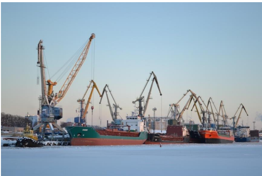
Рис. 1. Выборгский порт

«В городе функционируют 3 государственных музея: выборгский музей-заповедник, выборгский филиал Эрмитажа и парк Монрепо. Кроме того, есть муниципальный музей и несколько частных музеев. И все равно выходит, что этого недостаточно, раз мы работаем над расширением наших возможностей. Понятно, что в связи с этим уровень развития сферы услуг в Выборге ощутимо выше, чем в любом среднестатистическом городе по России (Тихвин, Гатчина, Всеволожск); больше гостиниц, кафе, экскурсионных услуг. Выборг – единственный город в Ленобласти, в котором находится отдельный государственный театр – Святая крепость».