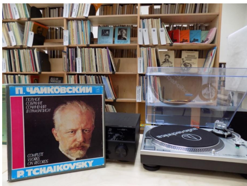
Рис.9. фонотека в библиотеке Аалто ( http://www.aalto.vbgcity.ru/news/node/node/node/node/418?page=55 )

«Гости города после многочасовых прогулок по Выборгу приходят сюда – в библиотеку Аалто, сидят в читальном зале или в отделе искусств. Обязательно посещают отдел краеведческой литературы. Очень большой интерес у них вызывает отдел искусств. В Ленобласти это единственный отдел специализированной литературы по искусству. Есть фонотека 20-го века. В отделе краеведческой литературы у нас очень много редких книг и фотоальбомов по истории Выборга прошлого и позапрошлого веков. Большинство книг, конечно, финского периода».