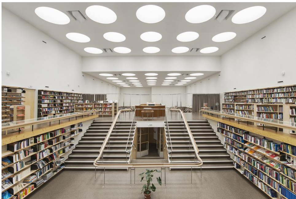
Рис.4. Библиотека Алвара Аалто ( http://www.aalto.vbgcity.ru/news/node/node/node/node/node/421?page=29 )