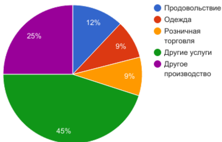
Марокко. Сферы МСП